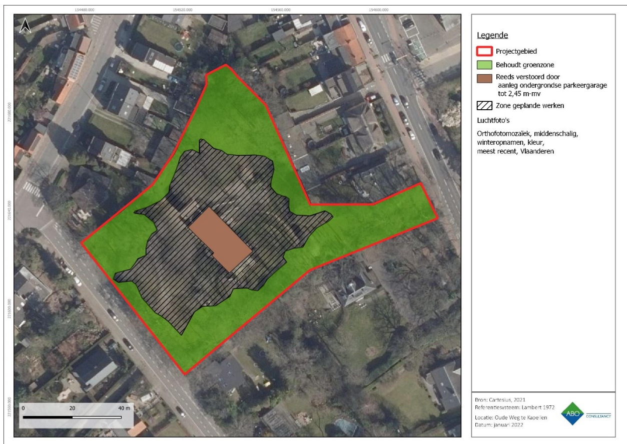
Figuur 38: Er wordt enkel een vooronderzoek geadviseerd voor de zwart gestreepte zone.

Er worden geen werkzaamheden uitgevoerd binnen een oppervlakte van 3.815 m 2 . Binnen deze zone zullen alle bomen blijven behouden. Gezien hier geen impact op het bodemarchief is, wordt dit deel van het projectgebied uitgesloten van verder onderzoek (zie groene kleur in Figuur 38). Daarnaast is een klein deel van het projectgebied (ca. 280 m 2 ) reeds diepgaand verstoord door de aanleg van een ondergrondse parkeergarage. Dit deel zal ook worden uitgesloten van verder onderzoek (zie bruine kleur in Figuur 38). Er wordt dus een vervolgonderzoek geadviseerd voor een zone van 3.160 m 2 (zie zwart gestreepte zone in Figuur 37). Enkel binnen dit deel van het projectgebied hebben de geplande werken impact op het bodemarchief.