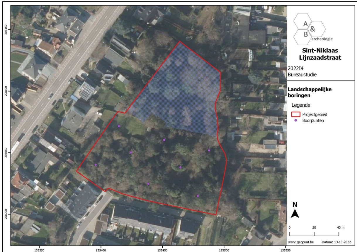
Figuur 2 Aanduiding van de boorpunten voor het landschappelijk booronderzoek binnen het plangebied, geprojecteerd op de luchtfoto van 2021.