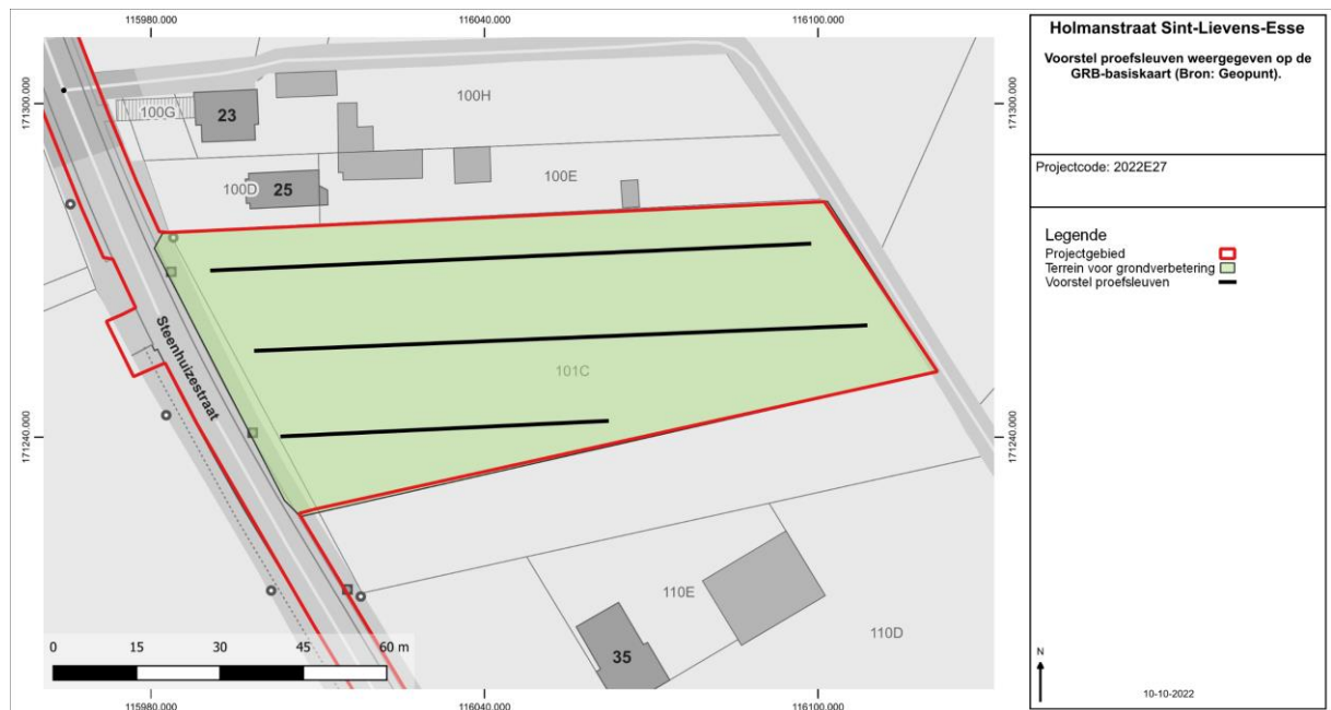
Figuur 4: Voorstel proefsleuven weergegeven op de GRB-basiskaart.

Het onderzoeksgebied voor de proefsleuven heeft een oppervlakte van ca. 5232 m 2 . De proefsleuven dienen 10% van de onderzoekbare oppervlakte te beslaan met bijkomend ca. 2,5% aan kijkvensters of dwars/volgsleuven waar relevant. De kijkvensters dienen voldoende groot te zijn om een antwoord te kunnen geven op de onderzoeksvragen.