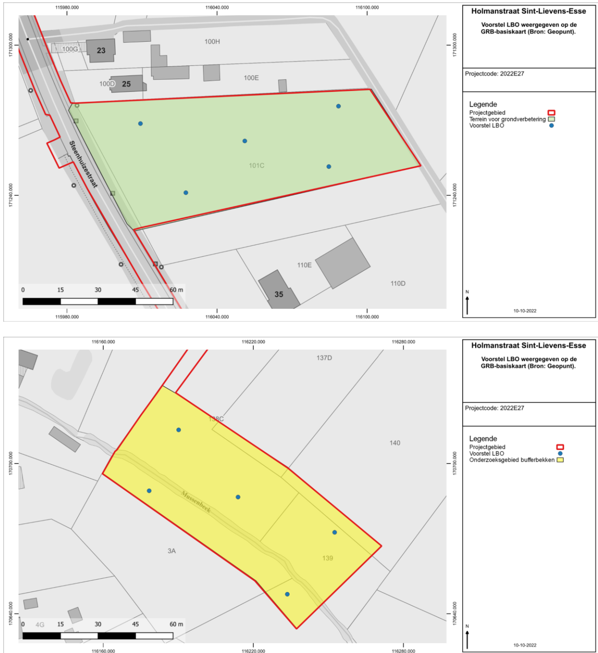
Figuur 3: Voorstel LBO weergegeven op de GRB-basiskaart (Bron: Geopunt).