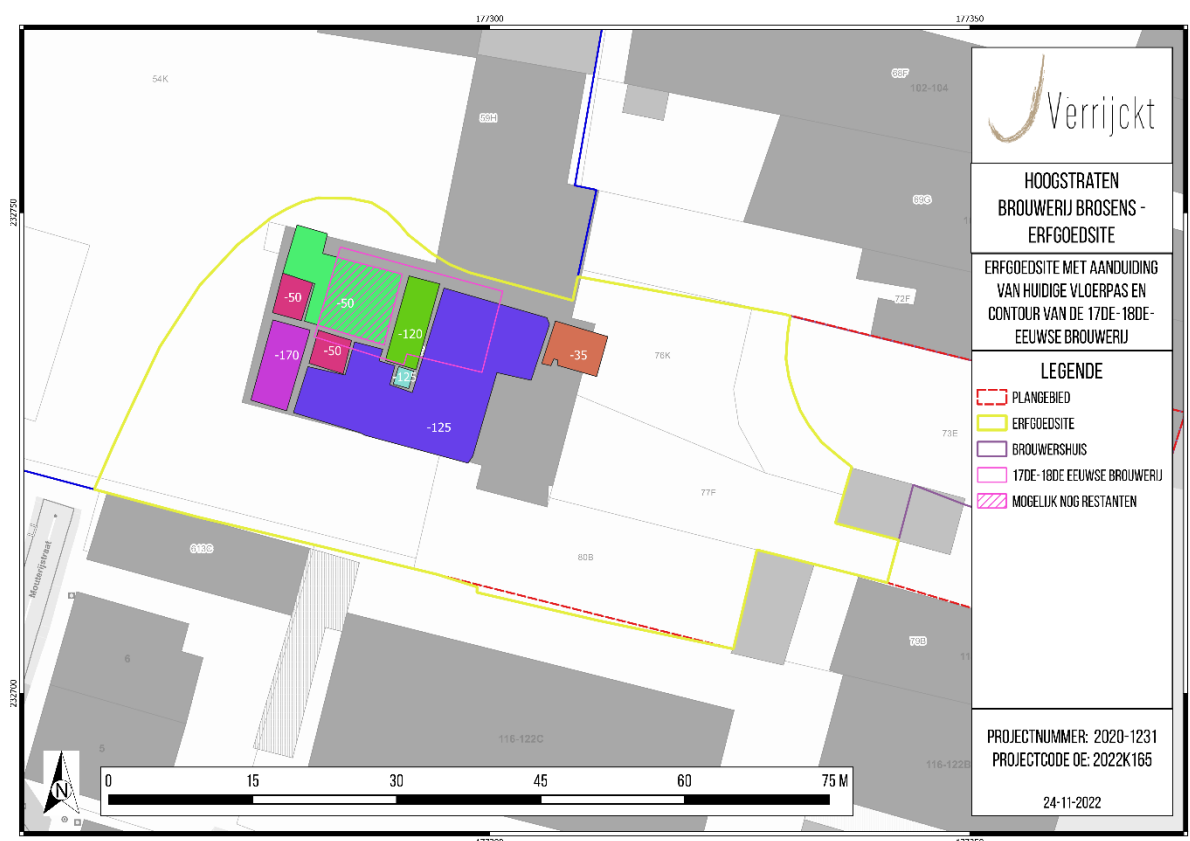
Figuur 4: Plan met weergave van de erfgoedsite, aanduiding van de huidige vloerpassn en de contour van de 17 de -18 de -eeuwse brouwerij (roze), met de zone waar eventueel nog resten van de vroegste fase bewaard kunnen zijn doordat de huidige uitgraving relatief beperkt is gebleven (roze gearceerd, zone archeologische begeleiding)

De zone voor een werkbegeleiding in de vorm van een opgraving omvat de geselecteerde zone van ca. 53 m 2 waar eventueel nog resten van de 17 de – 18 de -eeuwse brouwerijfase verwacht kunnen worden binnen het kader van de geplande werken. De vloerpas zal in deze zone 45 cm verlaagd worden. De geselecteerde zone is gebaseerd op de vroegste gebouwen die ter hoogte van de brouwerij worden afgebeeld op historisch kaartmateriaal, evenals de impact van de 19 de en 20 ste -eeuwse constructiefasen hierop, en de geplande werken. Op onderstaand plan dan ook een weergave van de zgn. contour (roze) van de 17 de -18 de -eeuwse fase, en de selectie van de zone (roze gearceerd) op basis van bestaande en toekomstige ingrepen.