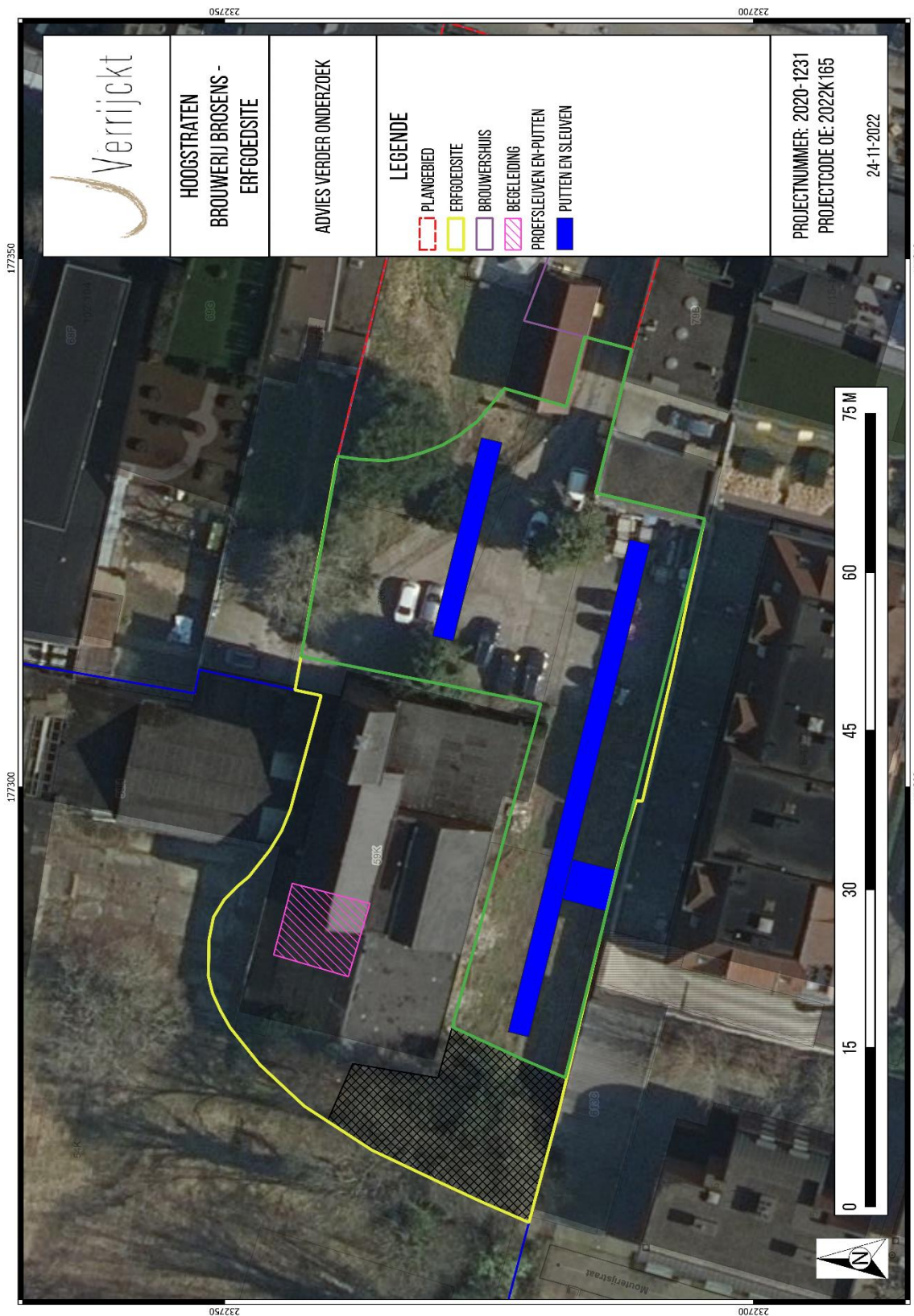
Figuur 3: Advies proefsleuven- en puttenonderzoek binnen de groen omkaderde zone en archeologische werfbegeleiding in de roze gearceerde zone, op orthofoto 6