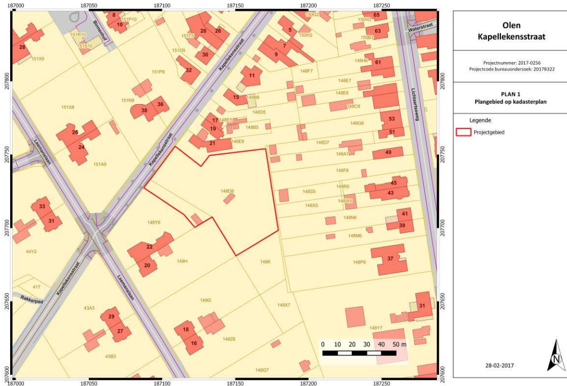
Figuur 2: Kadasterkaart met aanduiding projectgebied. (Geopunt Vlaanderen s.d.)