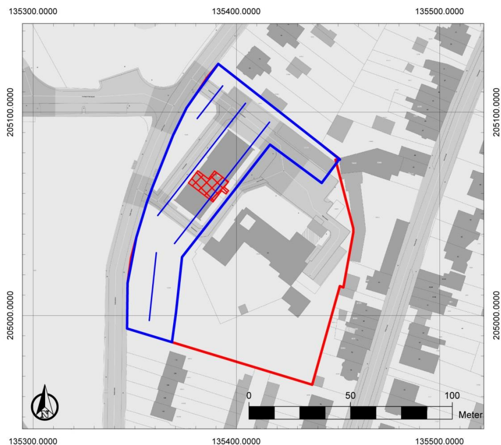
Figuur 3: Inplanting proefsleuvenonderzoek (blauw)