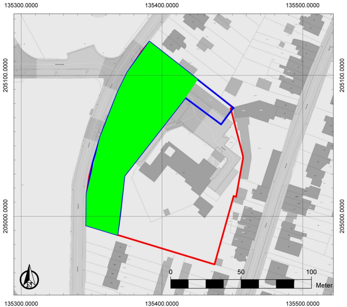
Figuur 2: Afbakening onderzoekszone voor uitgesteld vooronderzoek met ingreep in de bodem (groen)