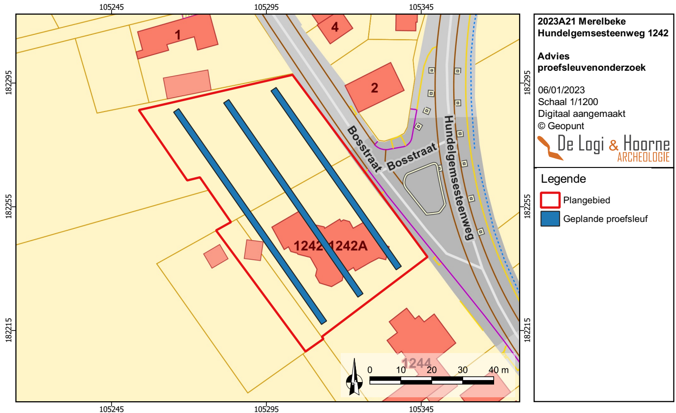
Figuur 27: Voorgesteld proefsleuvenonderzoek op de kadasterkaart (© Geopunt)

Alle aangesneden sporen, maar ook de locaties van vondsten, de contouren van de sleuven en kijkvensters, de hoogtes van het archeologisch vlak en het maaiveld (in m TAW), en de locatie en diepte van de profielputten worden met een GPS-toestel ingemeten. Proefsleuven, sporen en profielen worden gefotografeerd en beschreven. De sleuven en sporen worden op metalen objecten gescand met een metaaldetector. Van relevante sporen, of sporen met onduidelijke oorsprong wordt een doorsnede gemaakt. Van contexten waarvoor natuurwetenschappelijk onderzoek nuttig wordt geacht worden de nodige stalen genomen. Het volledige onderzoek wordt gedocumenteerd via foto's en een velddagboek. Wanneer specifieke contexten worden aangetroffen — menselijke resten, gebouwde archeologische structuren, concentraties met steentijd artefacten... — worden de gepaste richtlijnen in de Code van Goede Praktijk gevolgd (8.6.1.8. Specifieke sporen, spoorcombinaties en archeologische structuren).