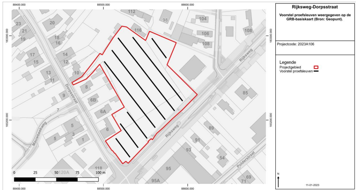
Figuur 3: Voorstel proefsleuven weergegeven op de GRB-basiskaart.

het ongeroerd sediment uitgegraven. Het vooronderzoek met ingreep in de bodem, zijnde veldwerk, verwerking en rapportage dienen te voldoen aan de bepalingen in de Code van Goede Praktijk.