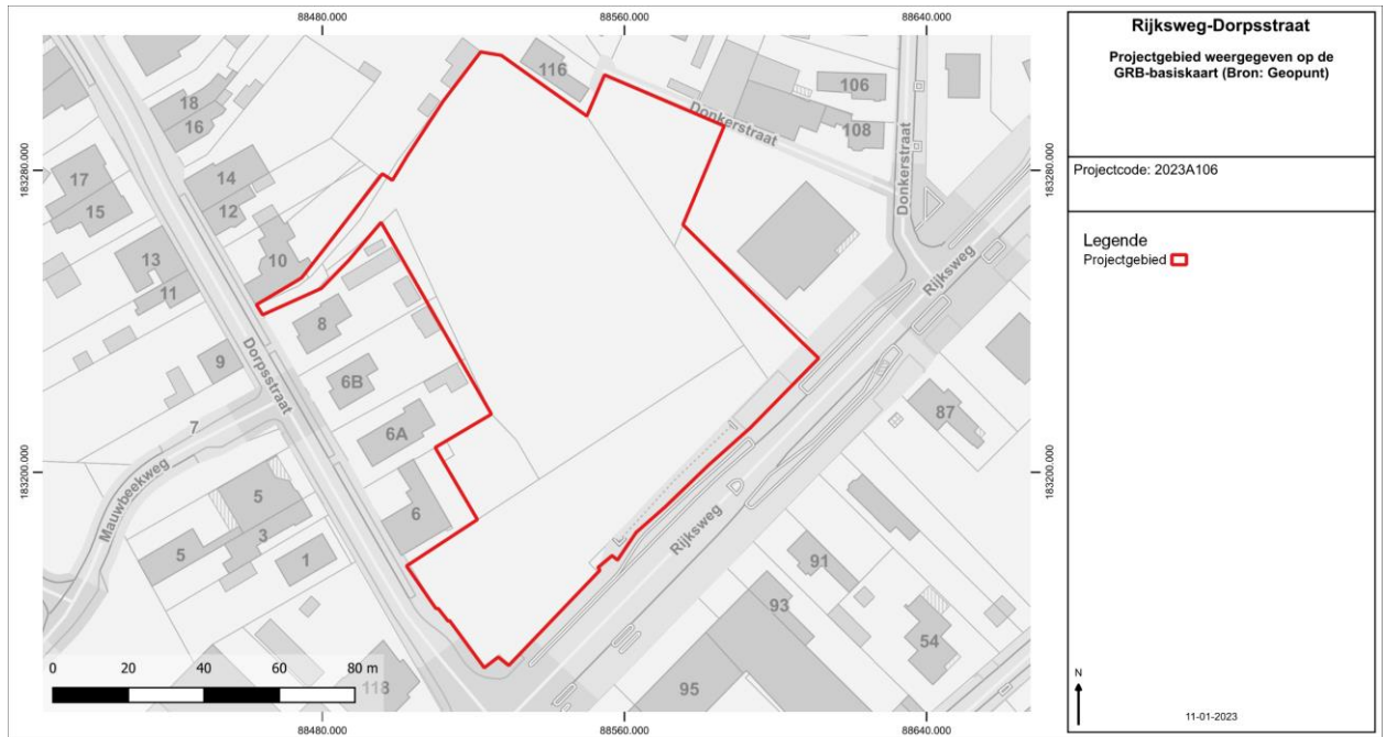
Figuur 1: Projectgebied weergegeven op de GRB-basiskaart.