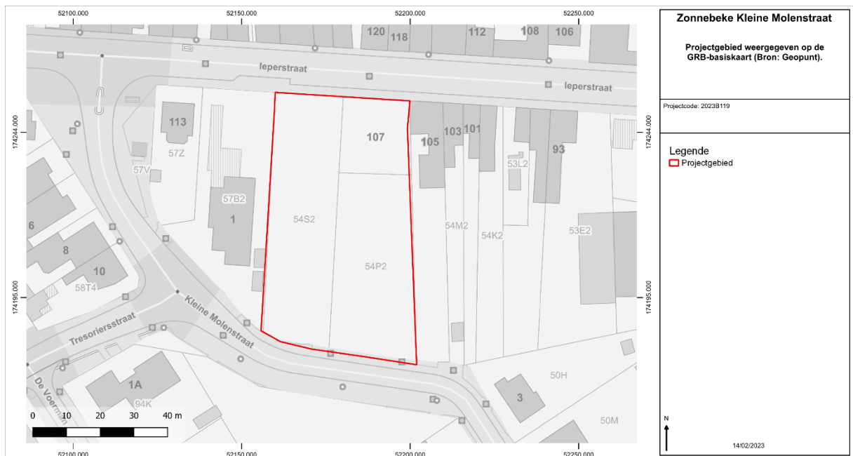
Figuur 1: Projectgebied weergegeven op de GRB-basiskaart.