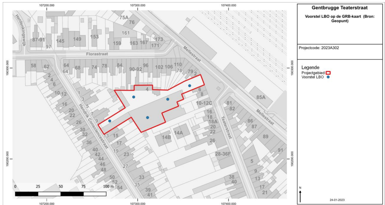
Figuur 2: Voorstel LBO weergegeven op de GRB-basiskaart.