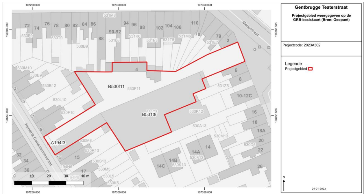
Figuur 1: Projectgebied weergegeven op de GRB-basiskaart.