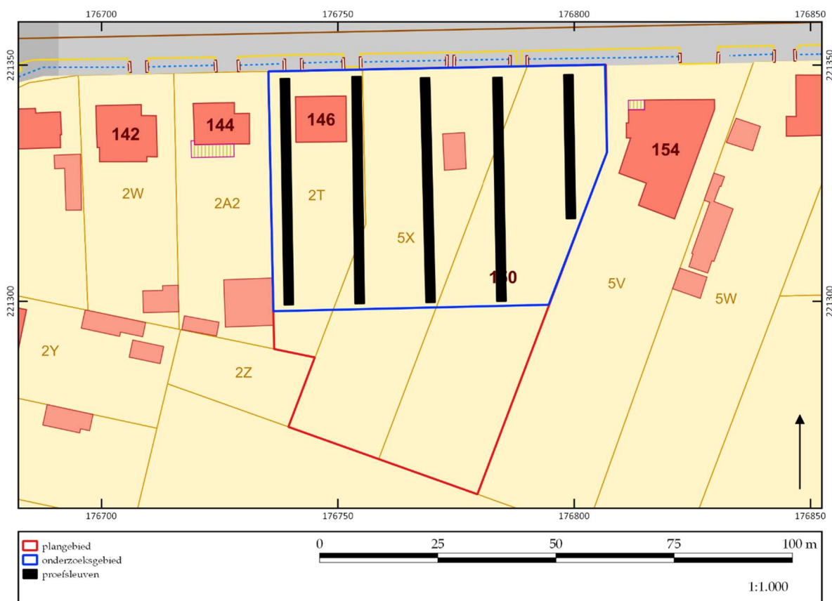
Figuur 3. Indicatieve ligging van de proefsleuven.

De proefsleuven zijn 2 m breed, tenzij lokaal een verbreding nodig is om sporen beter te kunnen interpreteren, in functie van het beantwoorden van de onderzoeksvragen. Er worden vijf noord-zuid georiënteerde sleuven voorzien. Deze sleuven vullen het inzicht dat verkregen is op basis van het landschappelijk onderzoek aan, maar geven ook een goed inzicht in de mogelijke archeologische resten die in het plangebied zouden kunnen zijn.