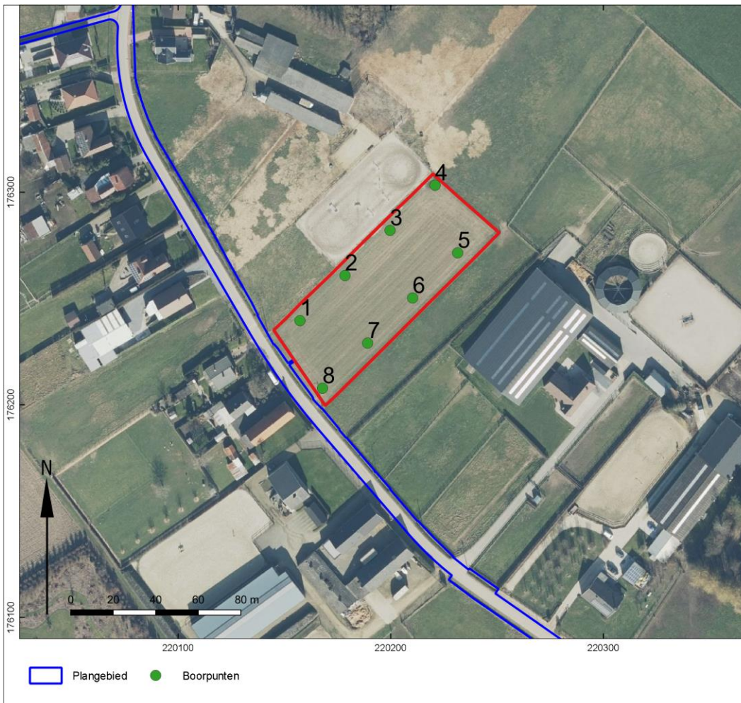
Afb. 2. Weergave van de landschappelijke boringen zoals uitgevoerd

Tijdens het landschappelijk bodemonderzoek werden 8 boringen uitgevoerd om de intactheid van de bodem na te gaan, en daarmee de kans op het aantreffen van intacte steentijdsites te onderzoeken. In 7 van de 8 boringen werd effectief een intact bodemprofiel aangetroffen. Als gevolg werd een zone afgebakend om in een tweede boorfase te onderzoeken of er steentijdvindplaatsen aanwezig zijn binnen het gebied met een intacte bodemopbouw.