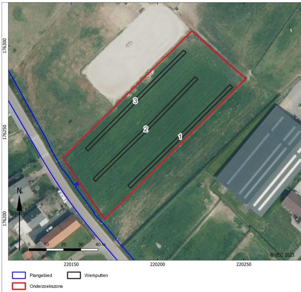
Afb. 4. Overzichtsplanning van de aangelegde proefsleuven.

Er werden 3 sleuven uitgegraven tijdens het proefsleuvenonderzoek (afb. 4).