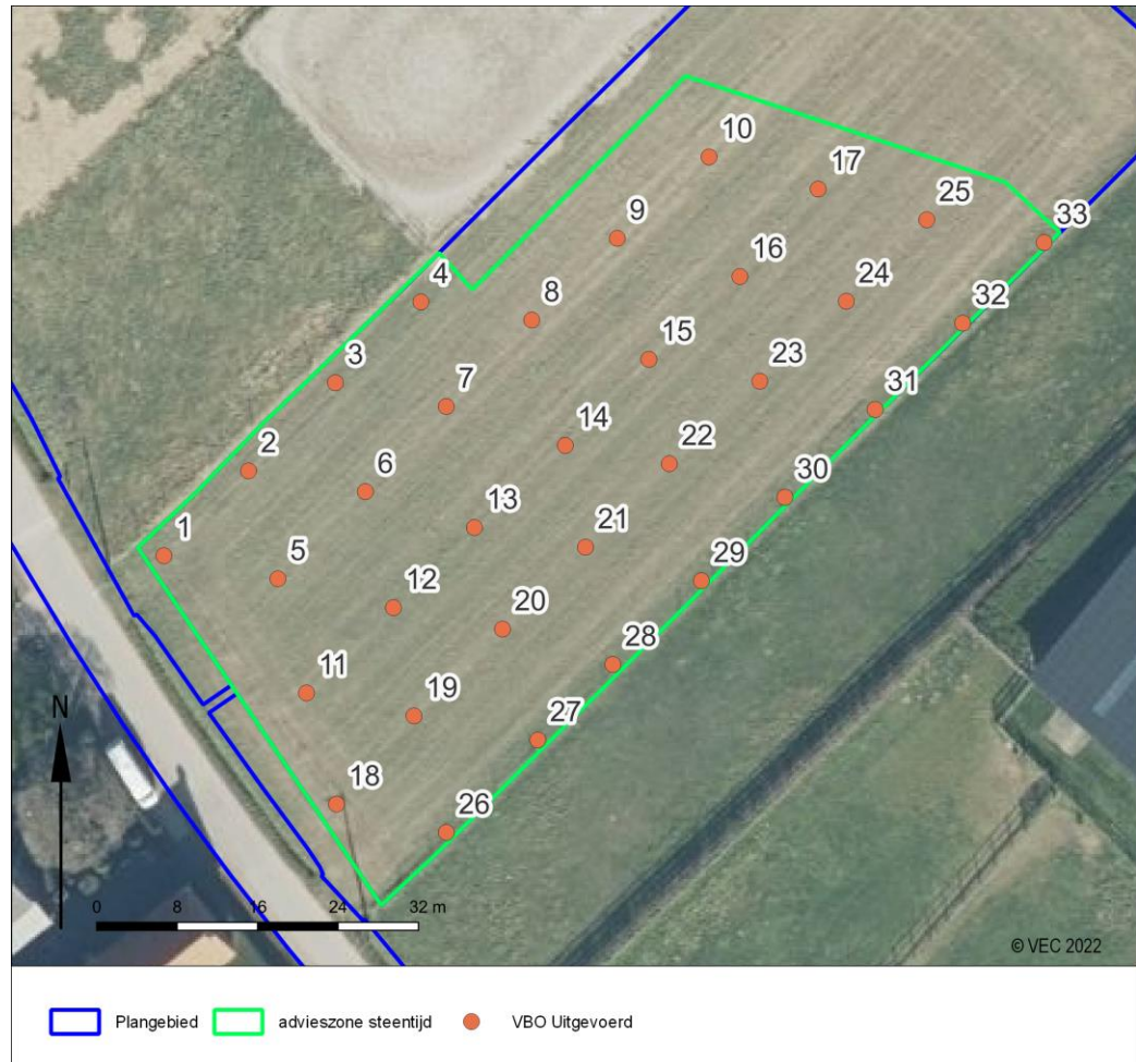
Afb. 3. Weergave van de verkennende boringen zoals uitgevoerd

Tijdens het verkennend booronderzoek werd er in een dichter grit en met een bredere boorkop in totaal 33 boringen gezet. Deze boringen lieten een gelijkaardige bodemopbouw zien als tijdens het landschappelijk bodemonderzoek. Van de boringen werden voldoende stalen genomen om na te gaan of er steentijdsites aanwezig zijn binnen het plangebied. De stalen werden gezeefd en nader onderzocht. Hieruit bleek dat er geen vondstmateriaal aanwezig was die zou kunnen duiden op de aanwezigheid van dergelijke sites.