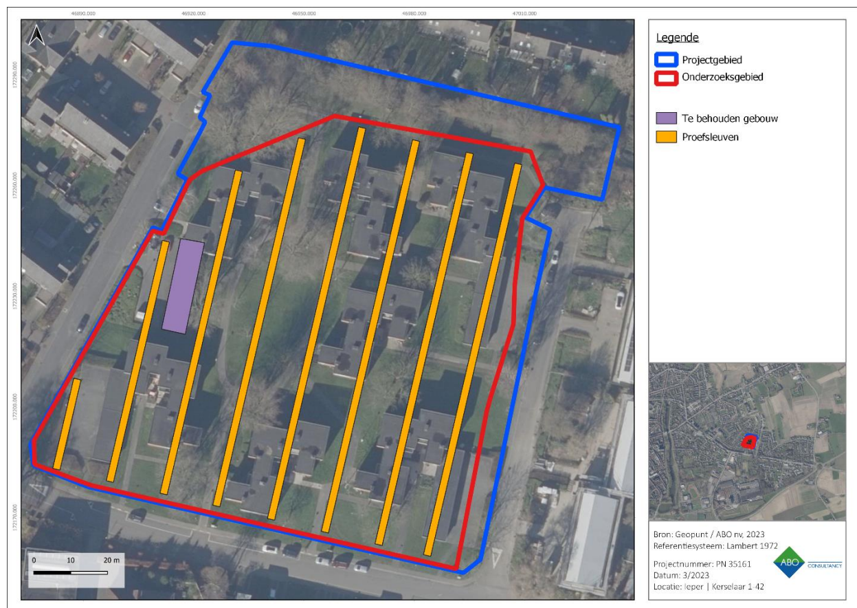
Figuur 63: Luchtfoto met indicatieve locatie van de proefsleuven.

Voor de aanleg van de proefsleuven wordt een graafmachine ingezet met een platte graafbak zonder tanden (CGP 8.6.2/3). In regel wordt één vlak aangelegd dat wordt onderzocht zoals beschreven in CGP 6.8.1.1. tot en met 8.6.1.9. De diepte van aanleg wordt tijdens de aanleg continu bijgestuurd op basis van minimaal twee putwandprofielen per sleuf, die bij voorkeur elke 50 meter geschrinkt geplaatst worden. Op basis van de putwanden wordt gekeken of zich dieperliggende niveaus met archeologische sporen en/of vondsten kunnen voordoen. In het voorkomende geval wordt op dit dieperliggend niveau lokaal een opgravingsvlak aangelegd en wordt dit ook onderzocht zoals beschreven in CGP 6.8.1.1. tot en met 8.6.1.9.