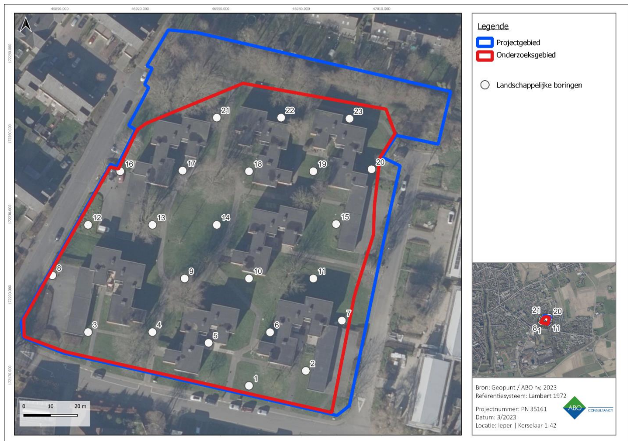
Figuur 62: Luchtfoto met aanduiding van de boorpunten voor het landschappelijk bodemonderzoek.