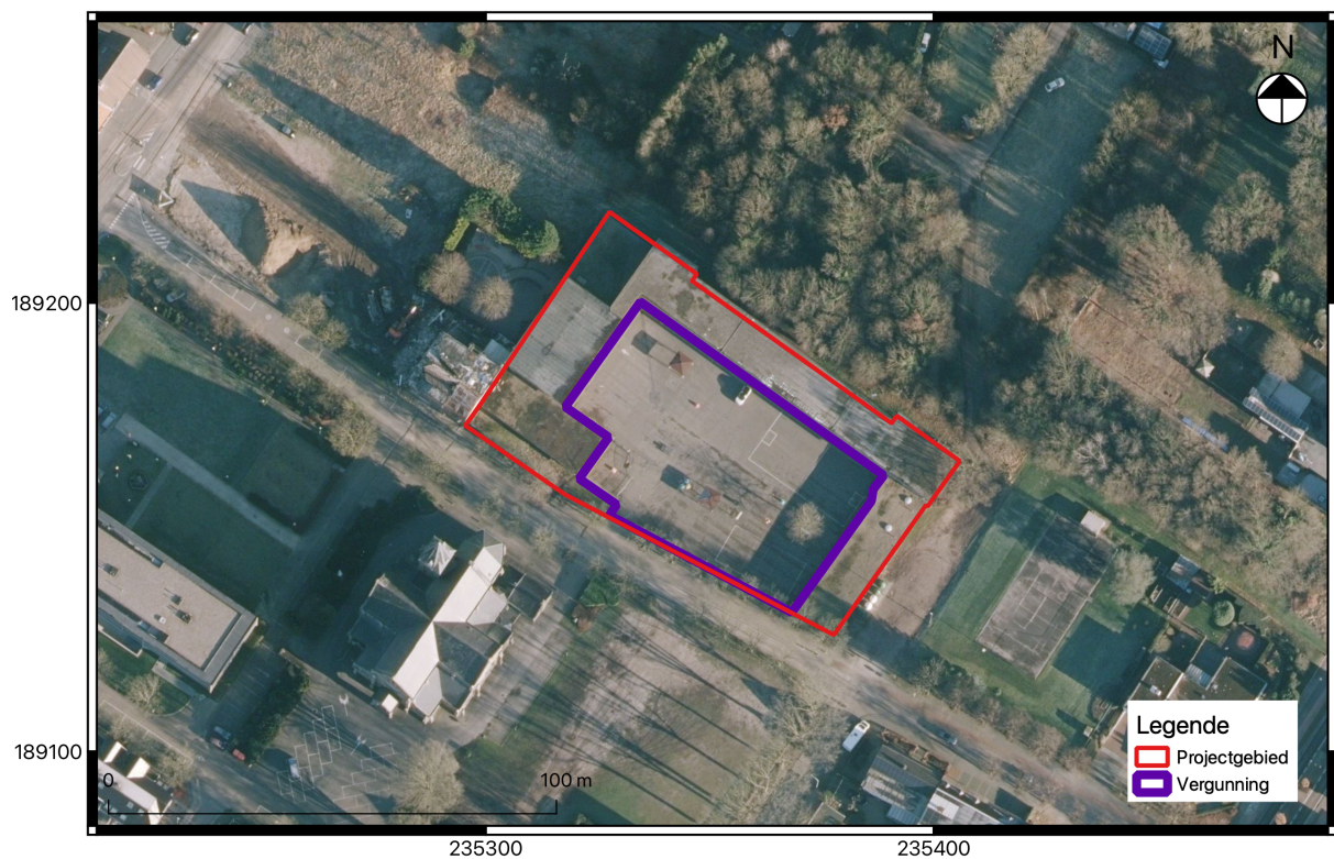
Fig. 2.2: Recente luchtfoto met aanduiding van het project- en vergunningsgebied.