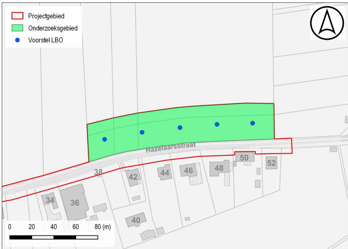
Figuur 3: Voorstel LBO t.a.v. GRB-basiskaart

De landschappelijke boringen worden gezet met een Edelmanboor met diameter van 7cm. Er worden minimaal 5 boringen gezet. De boringen dienen zo ingeplant te worden dat de waarnemingen toelaten vlakdekkende uitspraken te doen m.b.t. de bodemopbouw en verstoringsgraad. Het staat de uitvoerder van het landschappelijk bodemonderzoek vrij om meer boringen in te planten of de locatie van boringen te wijzigen teneinde een antwoord te kunnen formuleren op de onderzoeksvragen of om verstoorte zones of zones voor verder steentijdonderzoek in detail af te bakenen. Aangezien het landschappelijk bodemonderzoek als doel heeft de bodemopbouw binnen het plangebied te evalueren in functie van de archeologische bewaringscondities, dient het boorresidu niet gezeefd te worden. Gezien de mogelijke aanwezigheid van veel bouwpuin in de bodem is een mechanisch booronderzoek aangewezen.