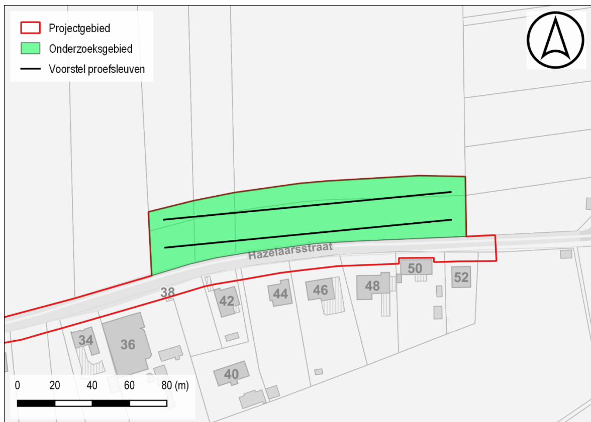
Figuur 4: Voorstel proefsleuven t.a.v. de GRB-basiskaart

De geplande werken hebben betrekking op oppervlakte van ca. 5625 m 2 . De proefsleuven dienen 10% van de onderzoekbare oppervlakte te beslaan met bijkomend ca. 2,5% aan kijkvensters of dwars/volgsleuven waar relevant. De kijkvensters dienen voldoende groot te zijn om een antwoord te kunnen geven op de onderzoeksvragen.