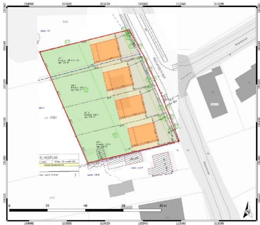
Figuur 2: Geplande werken geprojecteerd op de GRB-basiskaart (naar Swaelens 2020).

Het voorgaande onderzoek (bureauonderzoek en landschappelijk bodemonderzoek) bood onvoldoende informatie om de archeologische waarde van het terrein in te schatten. Er werd bijgevolg een proefsleuvenonderzoek geadviseerd en uitgevoerd op 15 november 2023. De verwerking is eveneens van start gegaan op 15 november 2023. Het onderzoek leverde in functie van deze nota voldoende gegevens op om een gefundeerd advies te formuleren.