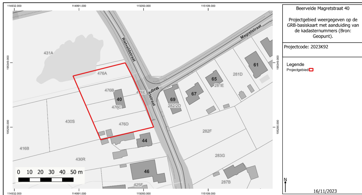
Figuur 1: Projectgebied met kadasternummers weergegeven op de GRB-basiskaart.