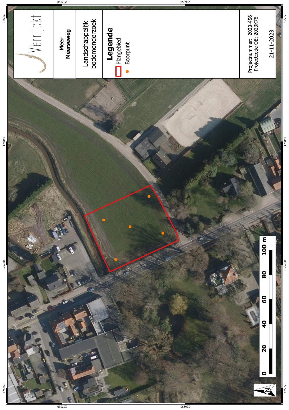
Figuur 3: Inplanting landschappelijke boringen