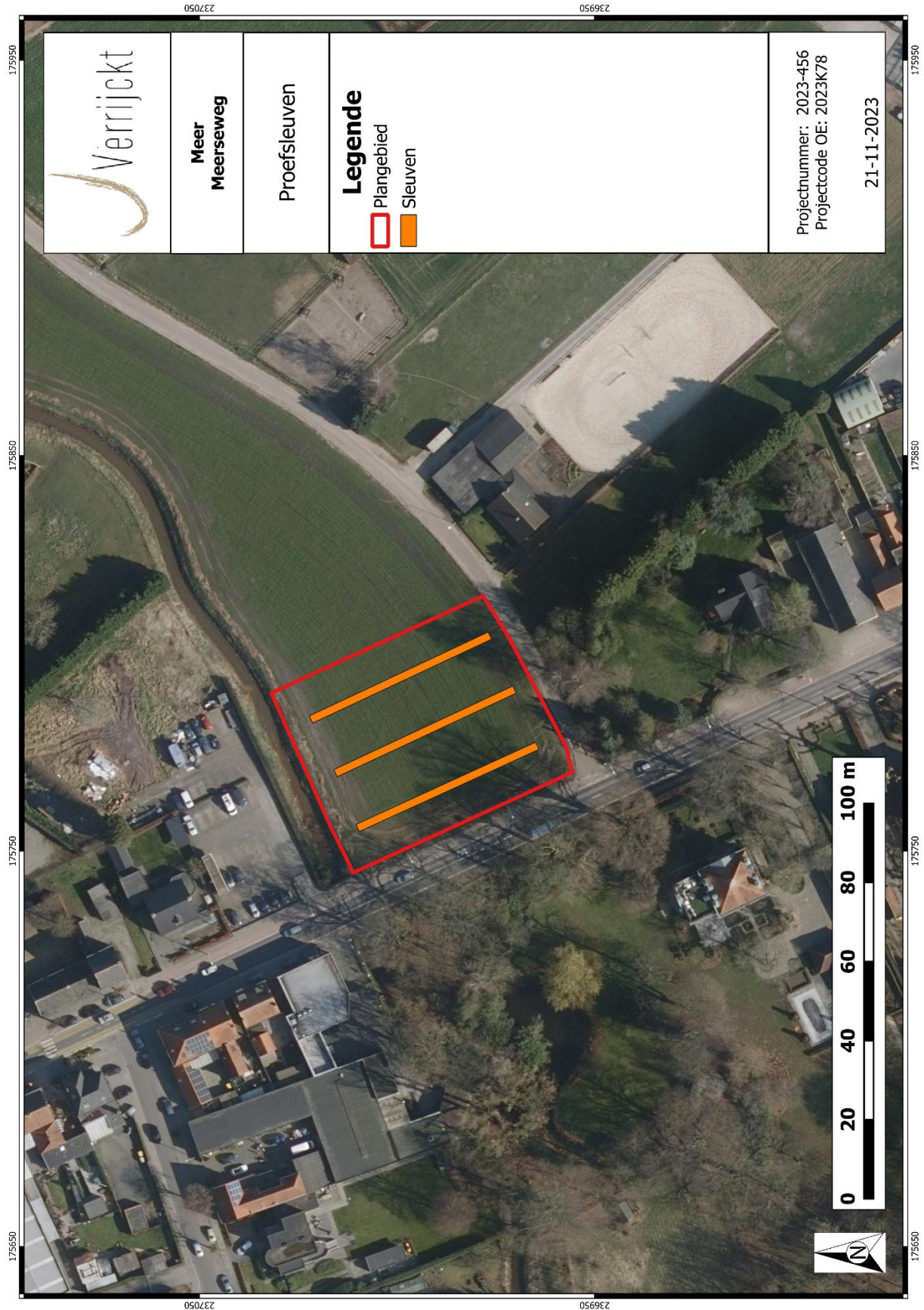
Figuur 4: Sleuvenplan