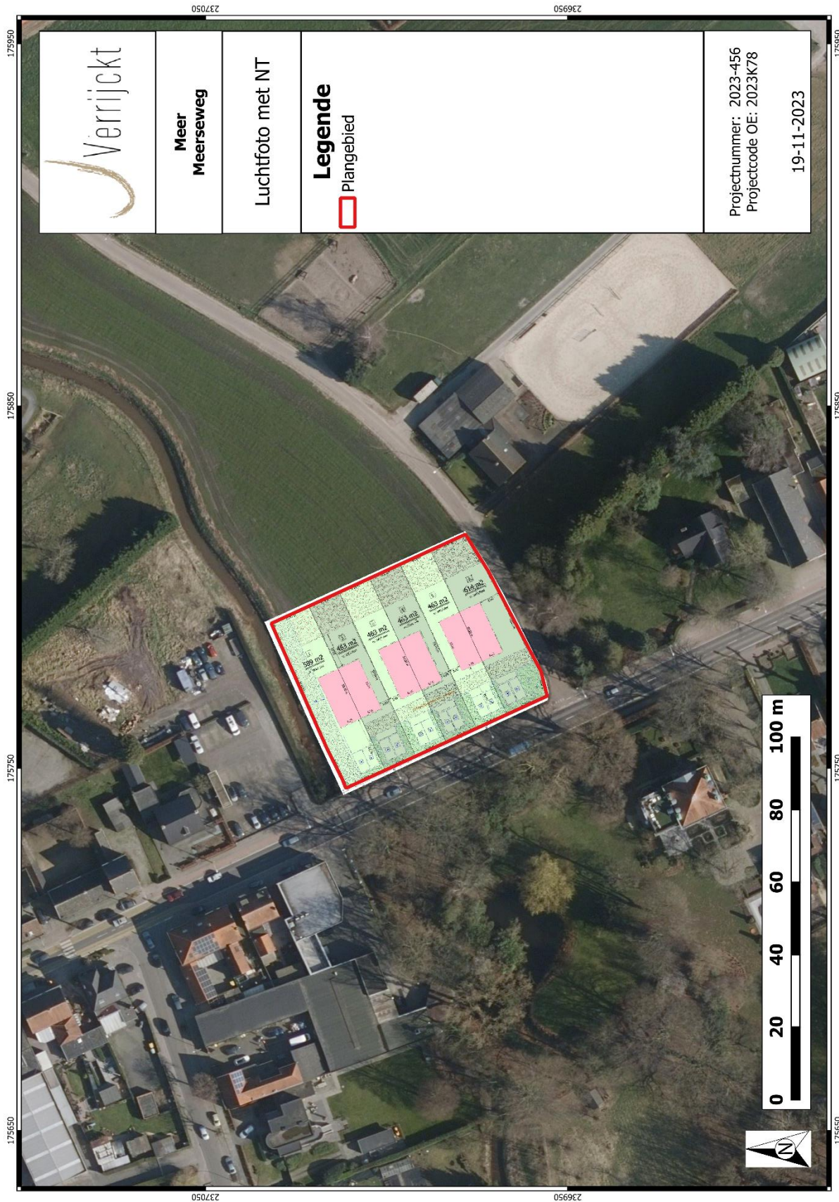
Figuur 1: Plangebied met weergave van toekomstige inplanting 1 op orthofoto 2