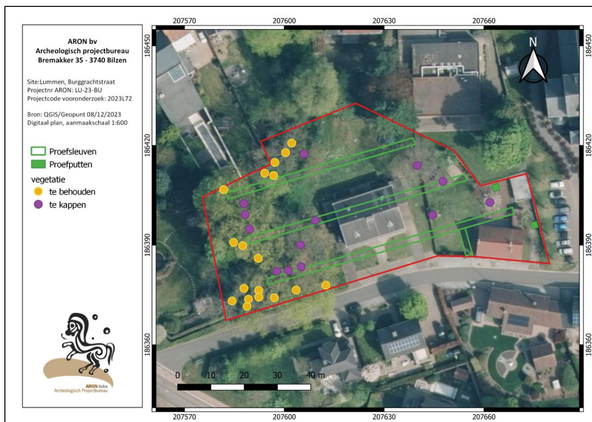
Afb. 2: Orthofoto met indicatie van de aan te leggen sleuven en putten (groen) op de zone voor vervolgonderzoek. In het geel de te behouden bomen, in het paars de te kappen vegetatie.

Bij de oriëntering van de sleuven wordt rekening gehouden met de kadastrale vorm van het onderzoeksgebied. Verder wordt hierbij ook rekening gehouden met de te behouden bomen in het projectgebied. T.h.v. de oude ijzerzandstenen muur wordt de sleuf onderbroken. Verder wordt een proefput naast de fundering van de muur aangelegd, om een uitspraak te kunnen formuleren over de ouderdom ervan. Om de aanwezigheid van de burggracht en een oudere fase van het kerkhof te evalueren wordt er tenslotte bijkomend een dwarsleuf voorzien op de burggracht en een extra proefput aan de grens met de huidige parking aan het kerkplein. Een indicatie van de richting van deze proefsleuven is terug te vinden op Afb. 2 .