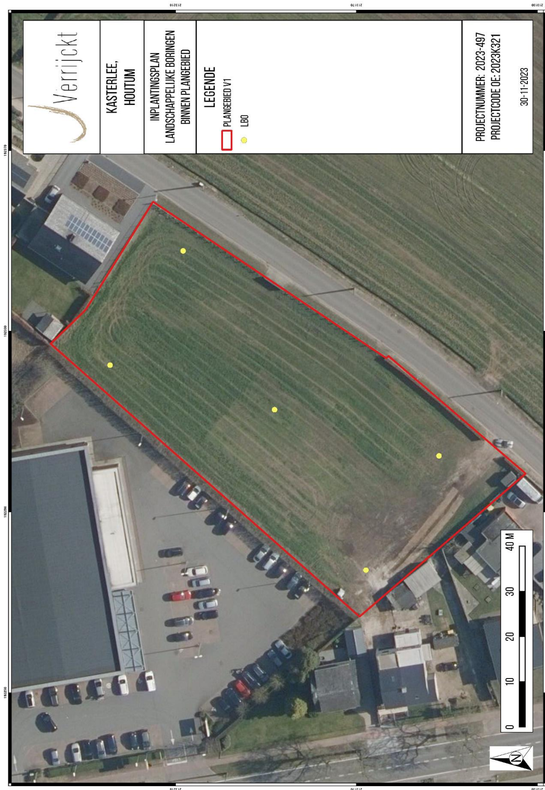
Figuur 2: Inplanting landschappelijke boringen