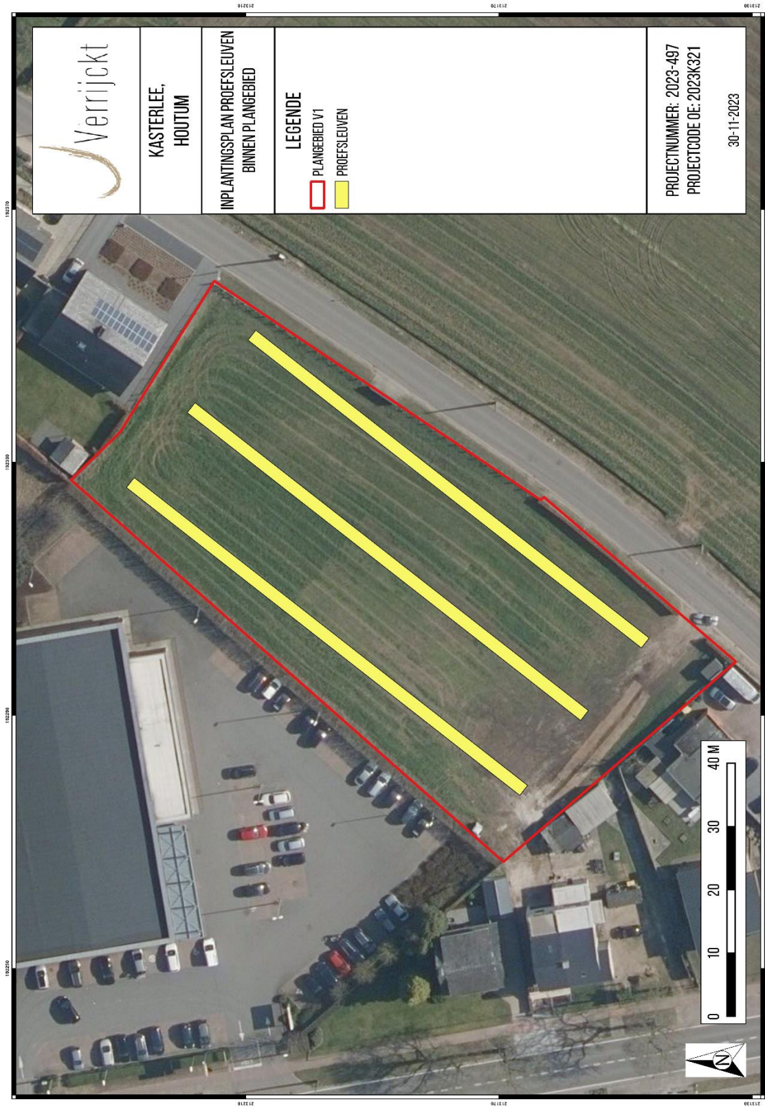
Figuur 3: Sleuvenplan