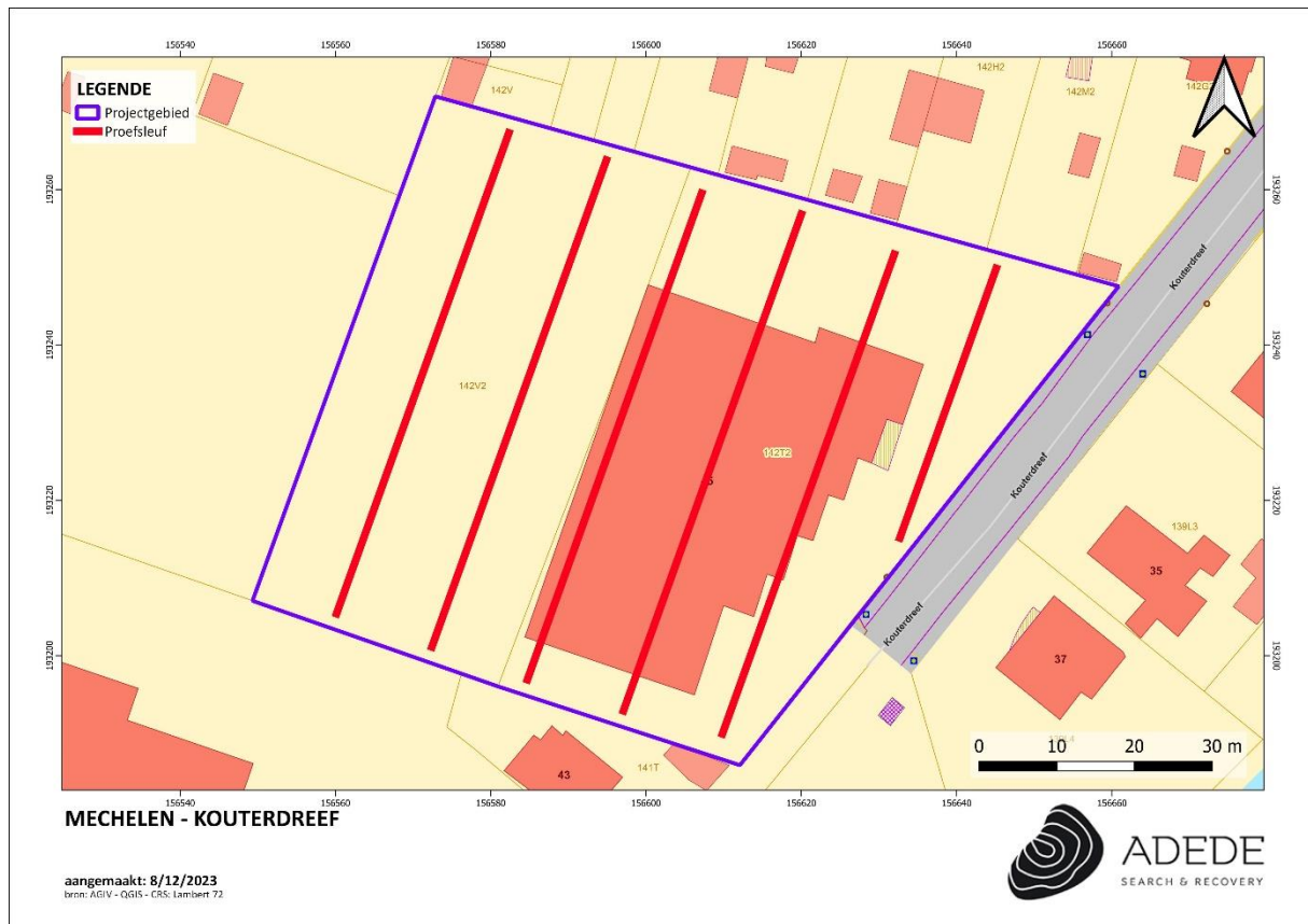
Figuur 2. Proefsleuvenplan