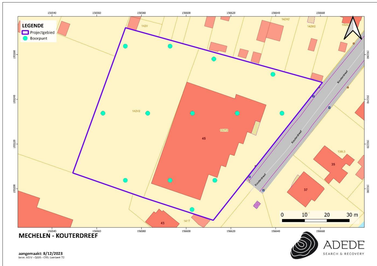
Figuur 1. Boorplan