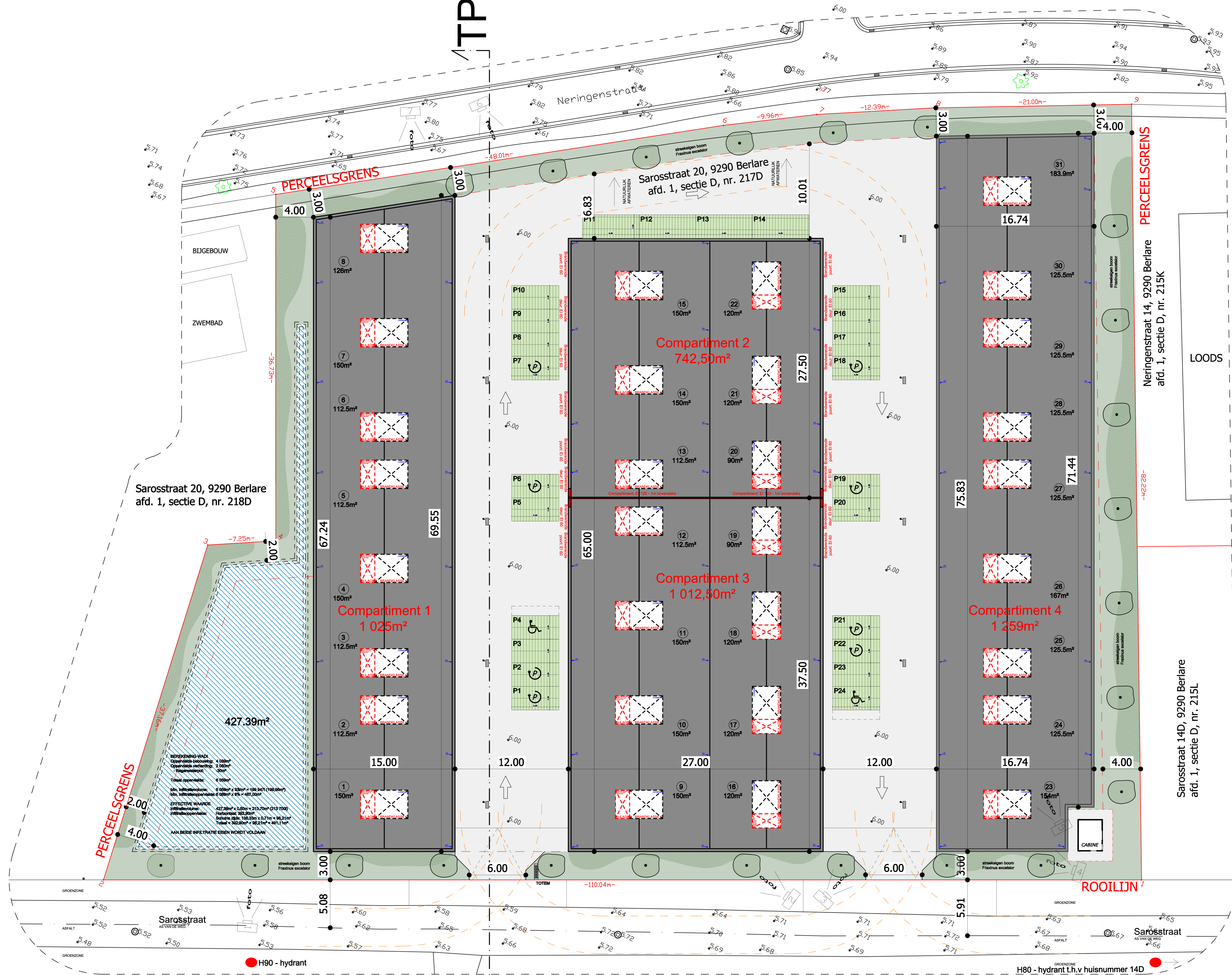
INPLANTINGSPLAN nieuwe toestand