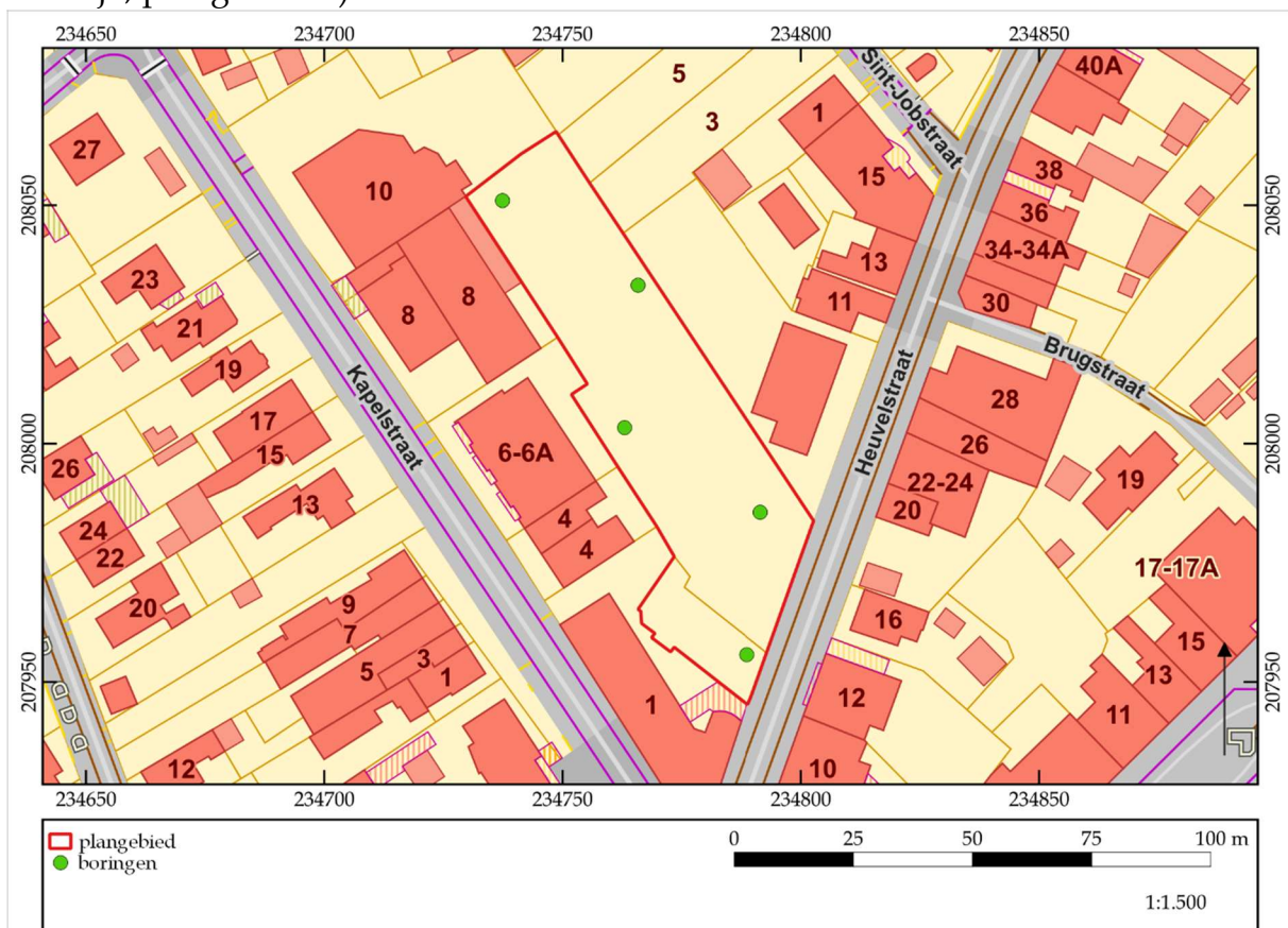
Figuur 2. Voorstel voor de boorlocaties in functie van het landschappelijk bodemonderzoek.

Om te bepalen of de bodem nog voldoende intact is om een goede bewaringstoestand van een eventuele steentijdsite te garanderen, zal in eerste instantie een landschappelijk bodemonderzoek uitgevoerd moeten worden in de eerste fase van het vervolgonderzoek. Hierbij zullen enkele boringen geplaatst worden, die inzicht zullen bieden in de bodemopbouw. Dit landschappelijk bodemonderzoek zal uitgevoerd worden aan de hand van een landschappelijk booronderzoek (Code van Goede Praktijk, paragraaf 7.3).