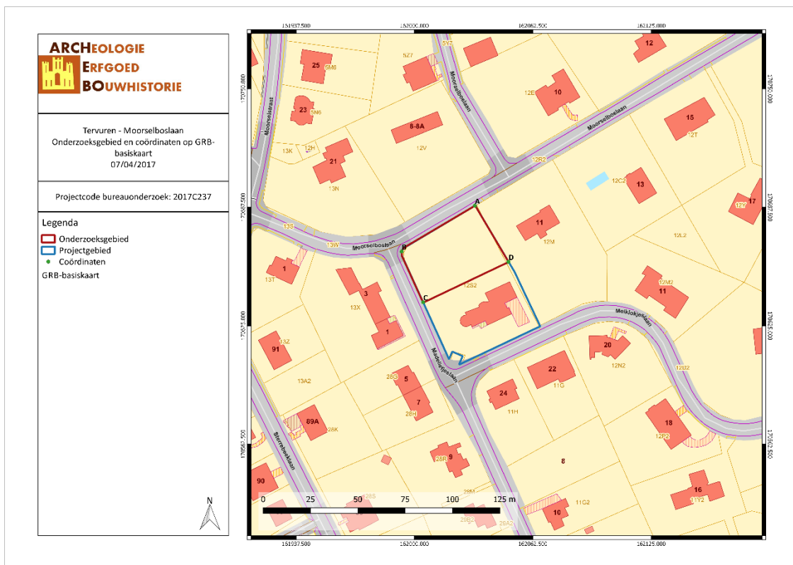
Figuur 1: Situering van het onderzoeksgebied op het GRB (Geopunt, 2017).