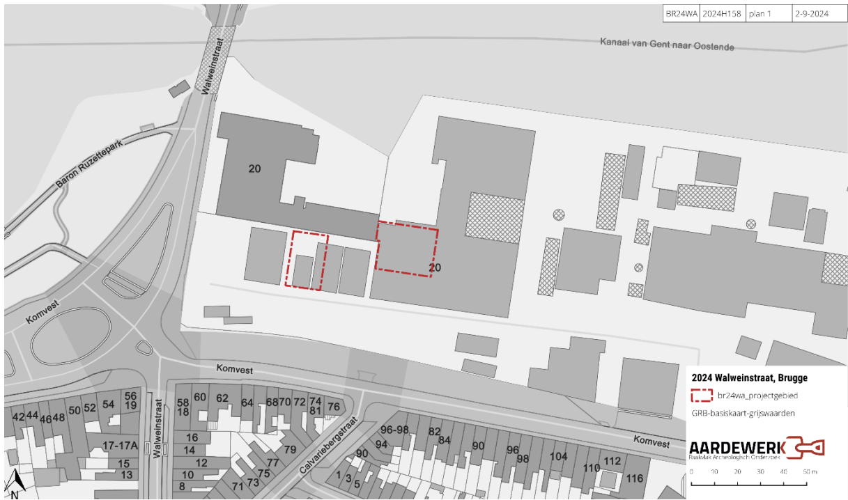
Figuur 1: Het projectgebied ten opzichte van de GRB-basiskaart (agiv)