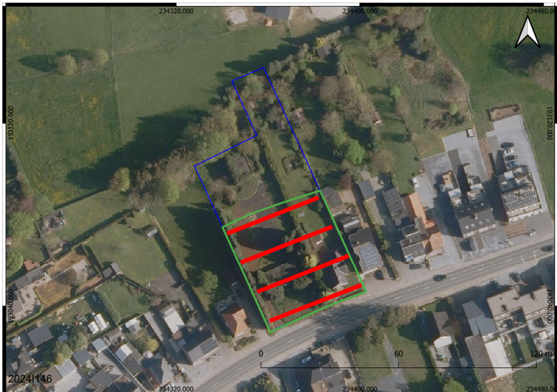
Afbeelding 1: Proefsleuvenplan op de luchtfoto als DHM.

Op basis van de resultaten van het bureauonderzoek en het landschappelijk booronderzoek wordt uitgegaan van één archeologisch onderzoeksniveau en dit onder het cultuurdek van een plaggenbodem.