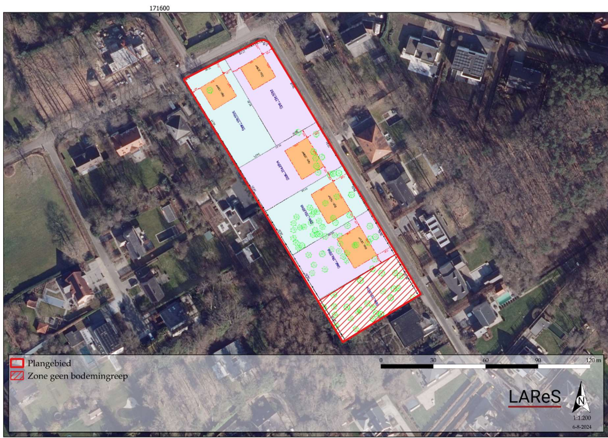
Figuur 3. Afbakening verkaveling met zone waarbinnen geen werkzaamheden plaatsvinden