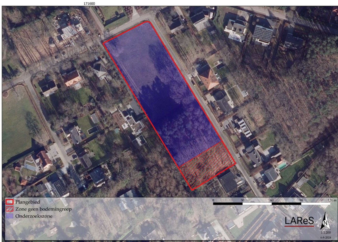
171600 Figuur 4. Afbakening onderzoeksgebied