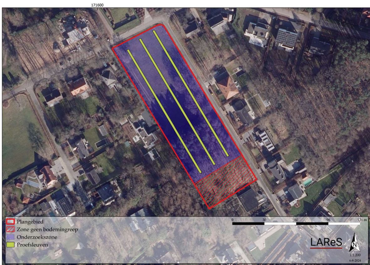
Figuur 6. Indicatieve ligging van de proefsleuven.

Het totale plangebied is ca. 9.134 m 2 groot. Het onderzoeksgebied kent een totale oppervlakte van 7.690 m 2 . Dit betekent dat, rekening houdend met de dekkinggraad van 12,5 % die door de Code van Goede Praktijk is voorgeschreven, er ongeveer 961 m 2 onderzocht moet worden. Hiervan bedraagt 769 m 2 proefsleuf (10 %) en 192 m 2 volgsleuven of kijkvensters (2,5 %). Aanvullend kunnen nog bijkomende kijkputten of volgsleuven aangelegd worden.