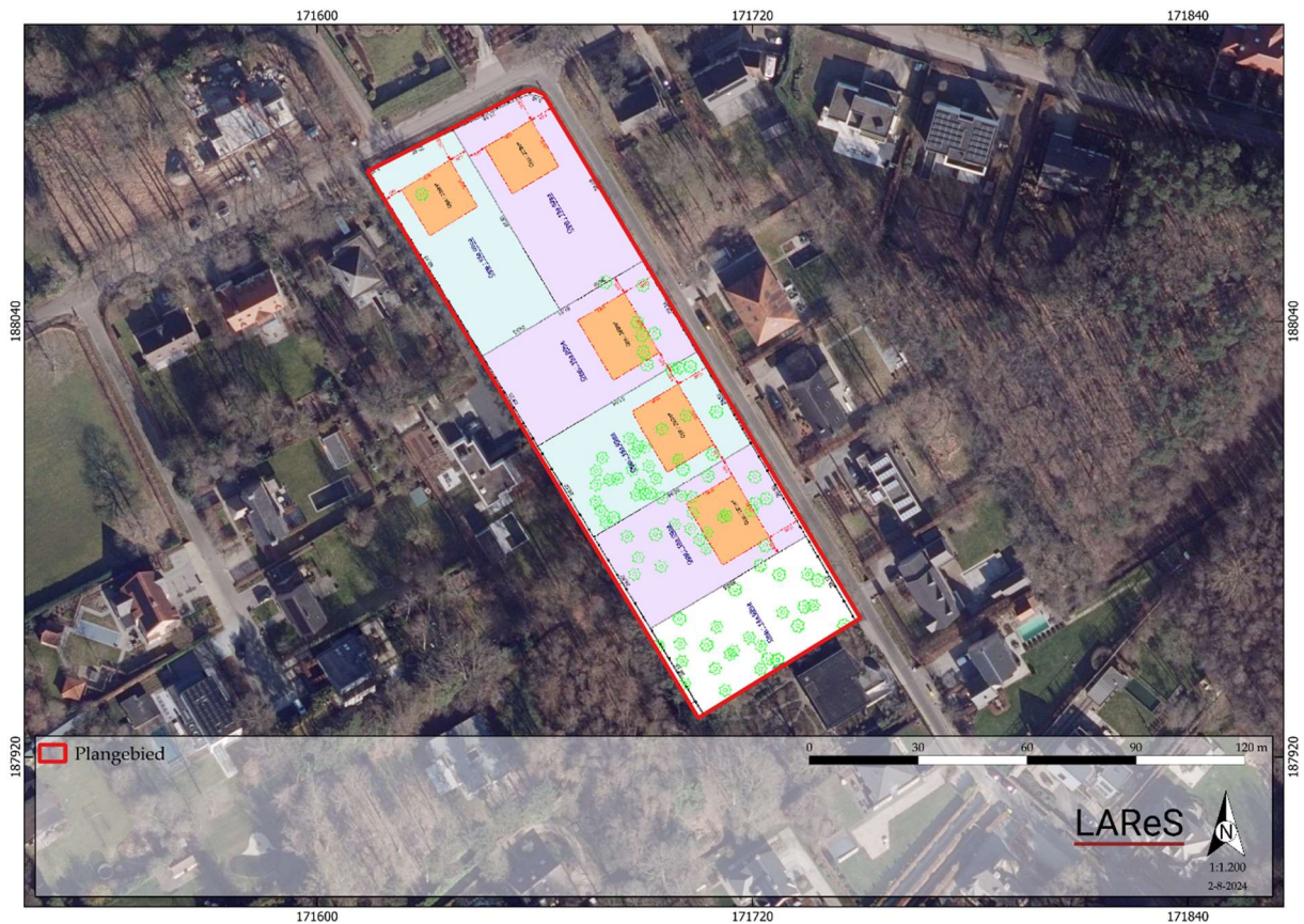
Figuur 2. Verkavelingsplan op meest recente orthofoto.