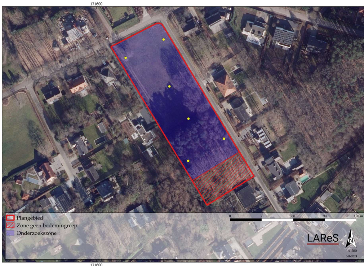
Figuur 5. Voorstel voor de boorlocaties in functie van het landschappelijk bodemonderzoek.