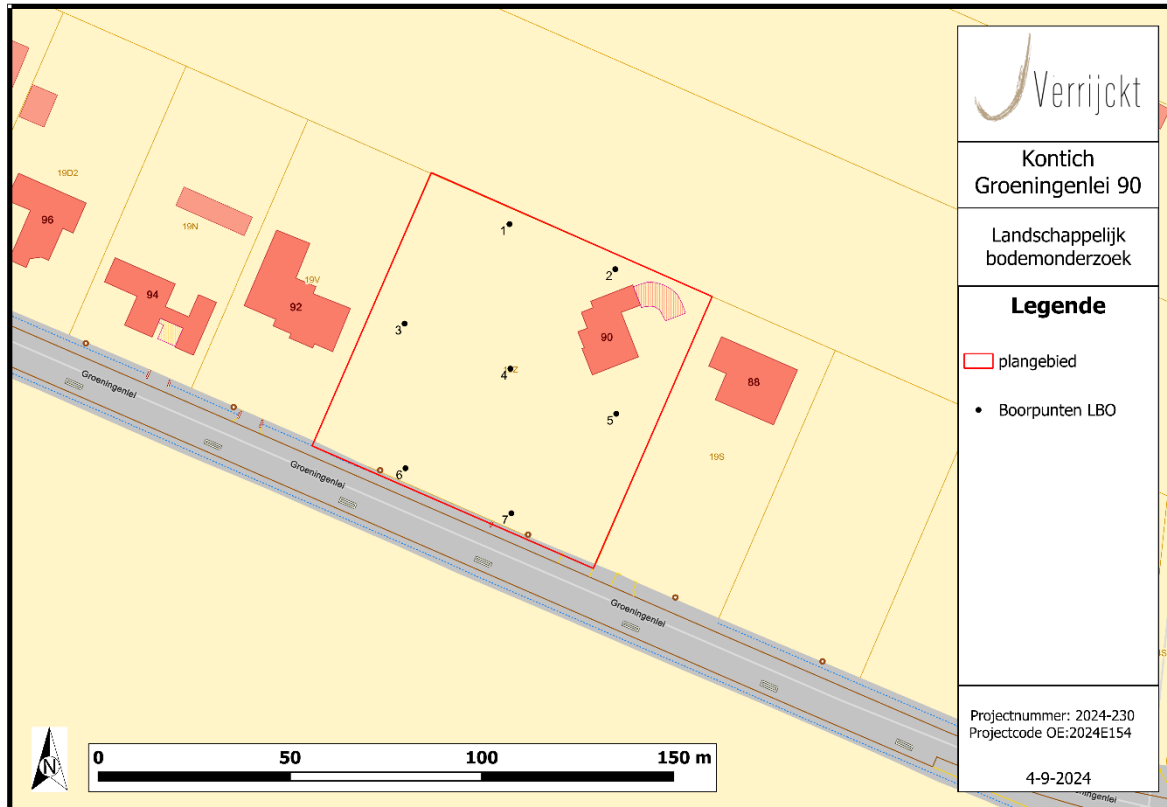
Figuur 3: Inplanting landschappelijke boringen