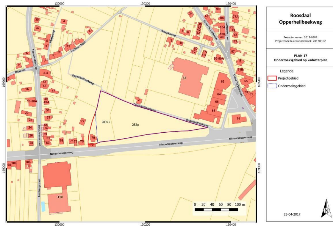
Figuur 2: Kadasterkaart met aanduiding projectgebied. (Geopunt Vlaanderen s.d.)

Oppervlakte onderzoeksgebied: ca. 14.789 m 2