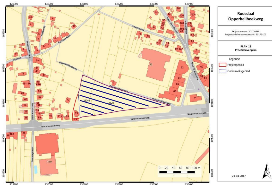
Figuur 3: Voorstel proefsleuvenplan. (A. Devroe 2017)

De sleuven worden parallel aan de Opperheilbeekweg aangelegd. De sleuven hebben een breedte van 2 m en een maximale afstand van 15m van middelpunt tot middelpunt. Er zal minstens 10% van het onderzoeksgebied door middel van proefsleuven onderzocht worden, aangevuld met 2,5% dwarssleuven en/of kijkvensters. De hoeveelheid en locatie van dwarssleuven en/of kijkvensters zijn vrij te bepalen door de erkend archeoloog/veldwerkleider. Een keuze voor of tegen het aanleggen van dwarssleuven en/of kijkvensters wordt gemotiveerd in het verslag van resultaten van het proefsleuvenonderzoek. Kijkvensters en/of dwarssleuven kunnen bijvoorbeeld aangelegd worden om na te gaan of aangetroffen paalkuilen deel uitmaken van een structuur, maar kunnen evenzeer aangelegd worden om een meer exacte afbakening van een archeologische site te bekomen.