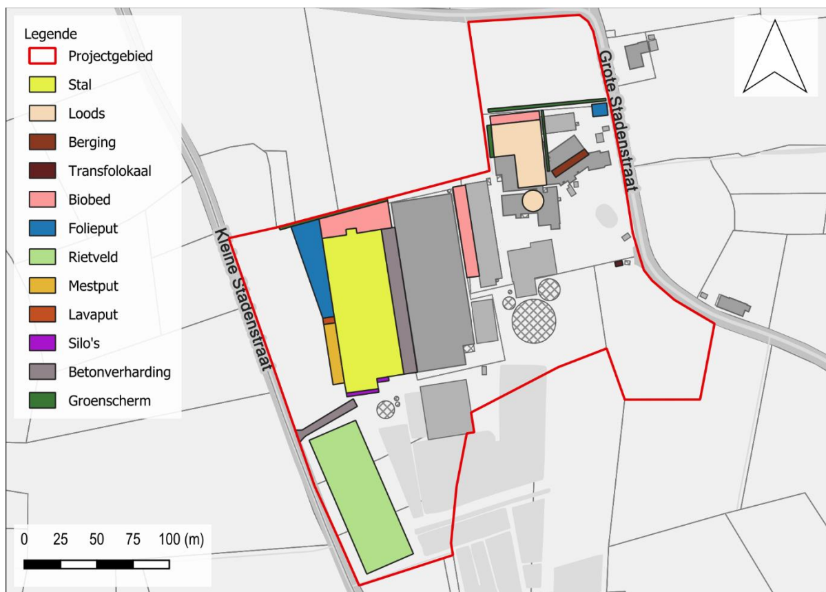
Figuur 1: Synthese geplande werken weergegeven op het GRB.

De opdrachtgever plant de realisatie van een nieuwbouwproject aan de Grote Stadenstraat 9 te Hooglede. De geplande ingrepen omvatten de bouw van een nieuwe loods en silo in het noorden van het terrein, de bouw van een nieuwe stal en berging, het aanleggen van meerdere folieputten en bezinkingsputten, de installatie van biobedden en een rietveld. Alles samen beslaan de geplande werken een gecombineerde oppervlakte van ca. 15 552 m 2 . In het kader van de geplande bouwwerken in het noorden van het plangebied wordt de aanwezige infrastructuur over een oppervlakte van ca. 2920 m 2 gesloopt. De gebouwen in deze noordelijke zone zijn onderkelderd.