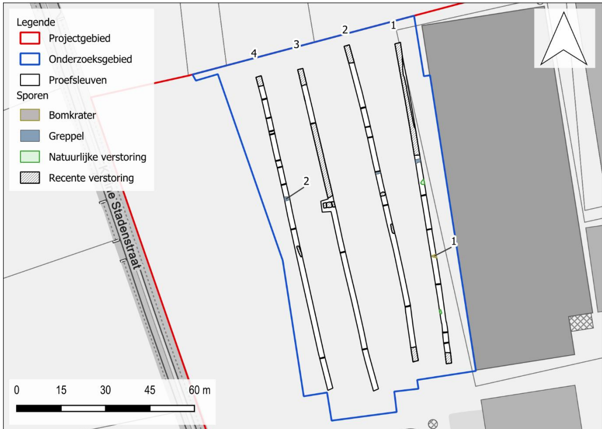
Figuur 2: allesporenkaart op het GRB.

Het proefsleuvenonderzoek bestond uit de aanleg van vier proefsleuven. Hierbinnen werden slechts twee sporen geregistreerd, een mogelijke bomkrater en een gracht/greppel uit een onbepaalde periode. Verder wees het onderzoek uit dat de top van de bodem duidelijke sporen van verstoringen en antropogene ingrepen vertoont, die lokaal zeer diep kunnen zijn. lokaal werden er ook ophogingspakketten aangetroffen. Er werden geen vondsten of stalen ingezameld.