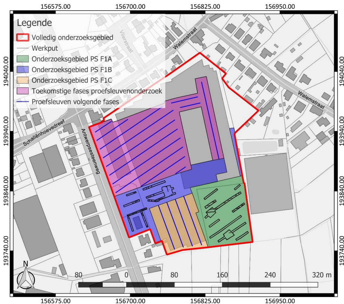
Figuur 3: Inplanting van de proefsleuven (blauw), weergegeven op het GRB ( www.geopunt.be )

De proefsleuven hebben een maximale tussenafstand van middelpunt tot middelpunt van 15 m. De beoogde oppervlakte die onderzocht dient te worden door middel van proefsleuven, bedraagt minimaal 10 %. Dit wordt behaald aan de hand van het vooropgestelde sleuvenplan, dat voorziet in 1548 lopende m proefsleuven.