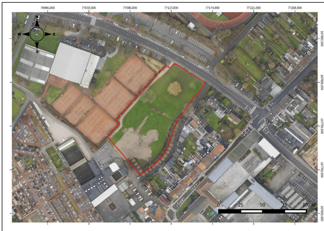
Figuur 1: Orthofotomozaïek (grootschalige winteropnamen, kleur 2013-2015) met aanduiding van het studiegebied (rood)