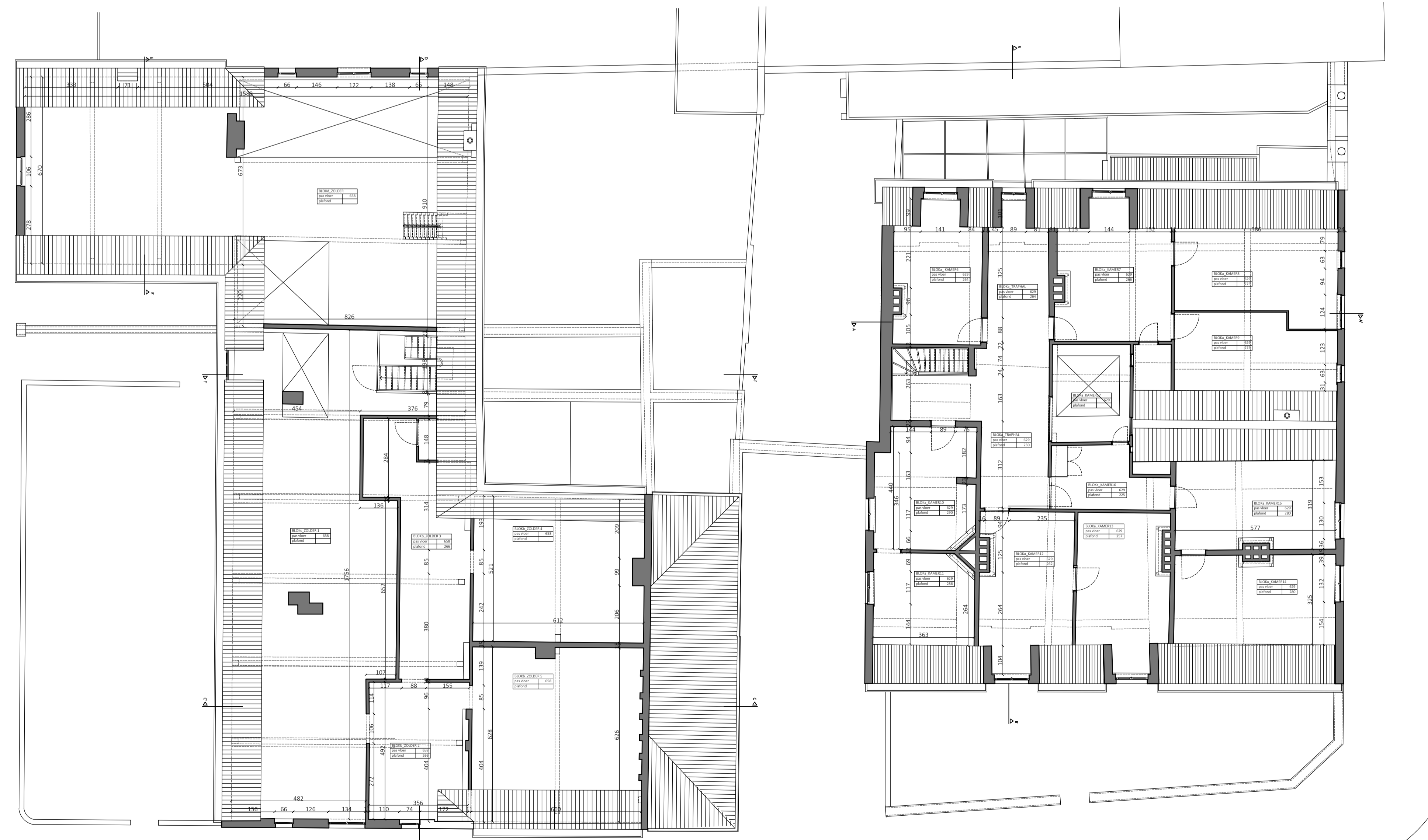
BESTAANDE TOESTAND VERDEPING 2 (ZOLDER)