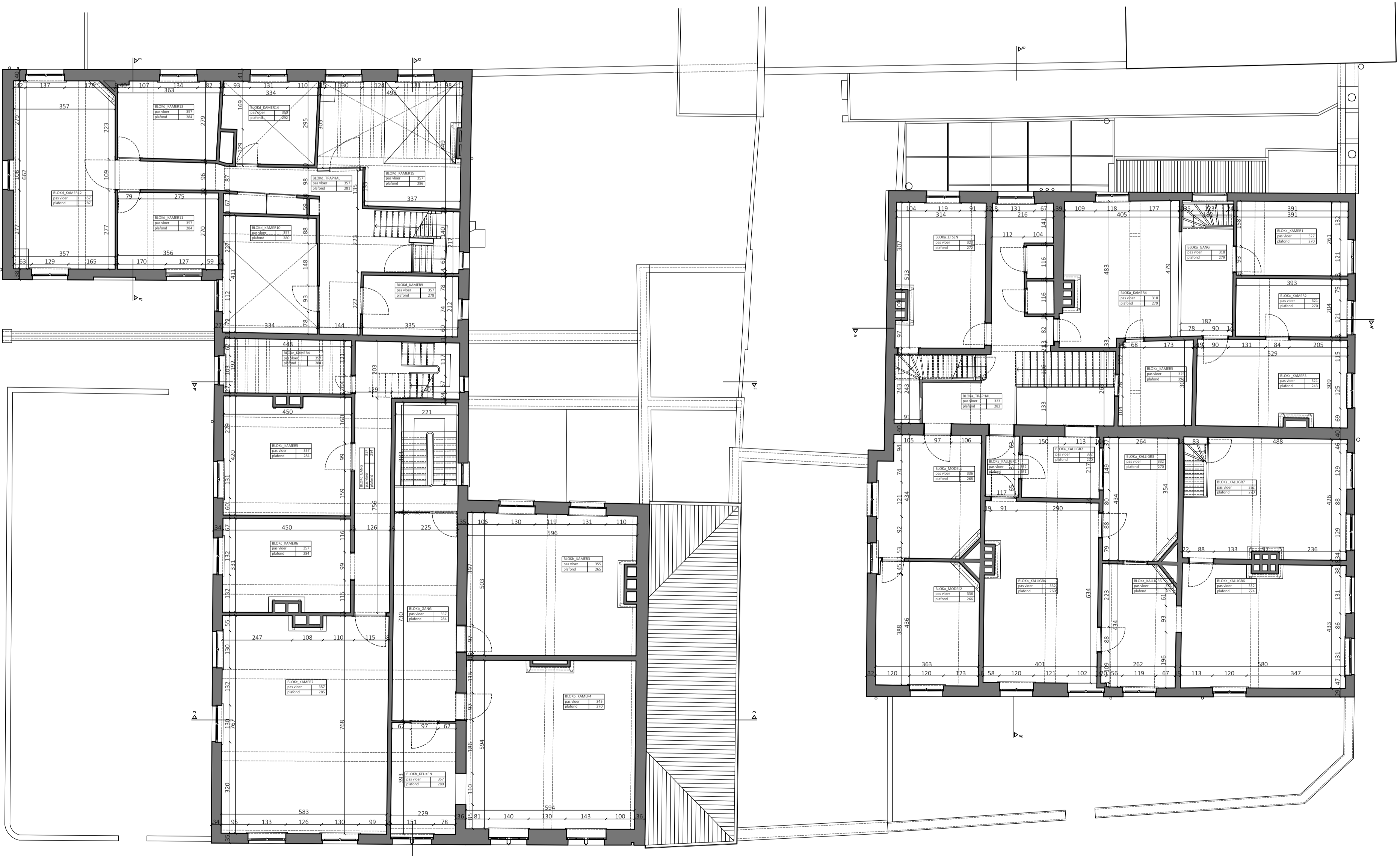
BESTAANDE TOESTAND VERDEPING 1