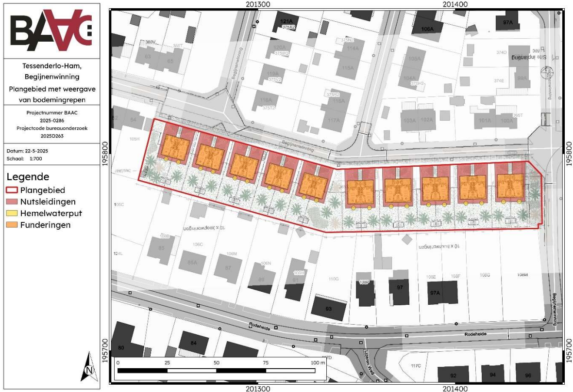
Plan 1: Plangebied met weergave van de geplande bodemingrepen (digitaal; 1:250; 22.05.2025)