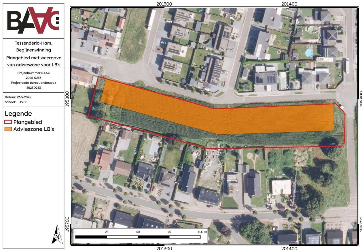
Plan 2: Plangebied met afbakening van de zone voor landschappelijk bodemonderzoek (digitaal; 1:1; 21.05.2025)