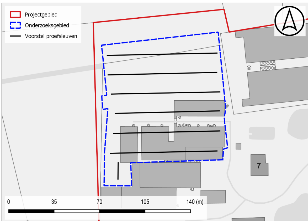
Figuur 4: Voorstel proefsleuven t.a.v. de GRB-basiskaart

Het onderzoeksgebied heeft een oppervlakte van ca. 9010 m 2 . De proefsleuven dienen 10% van de onderzoekbare oppervlakte te beslaan met bijkomend ca. 2,5% aan kijkvensters of dwars/volgsleuven waar relevant. De kijkvensters dienen voldoende groot te zijn om een antwoord te kunnen geven op de onderzoeksvragen.