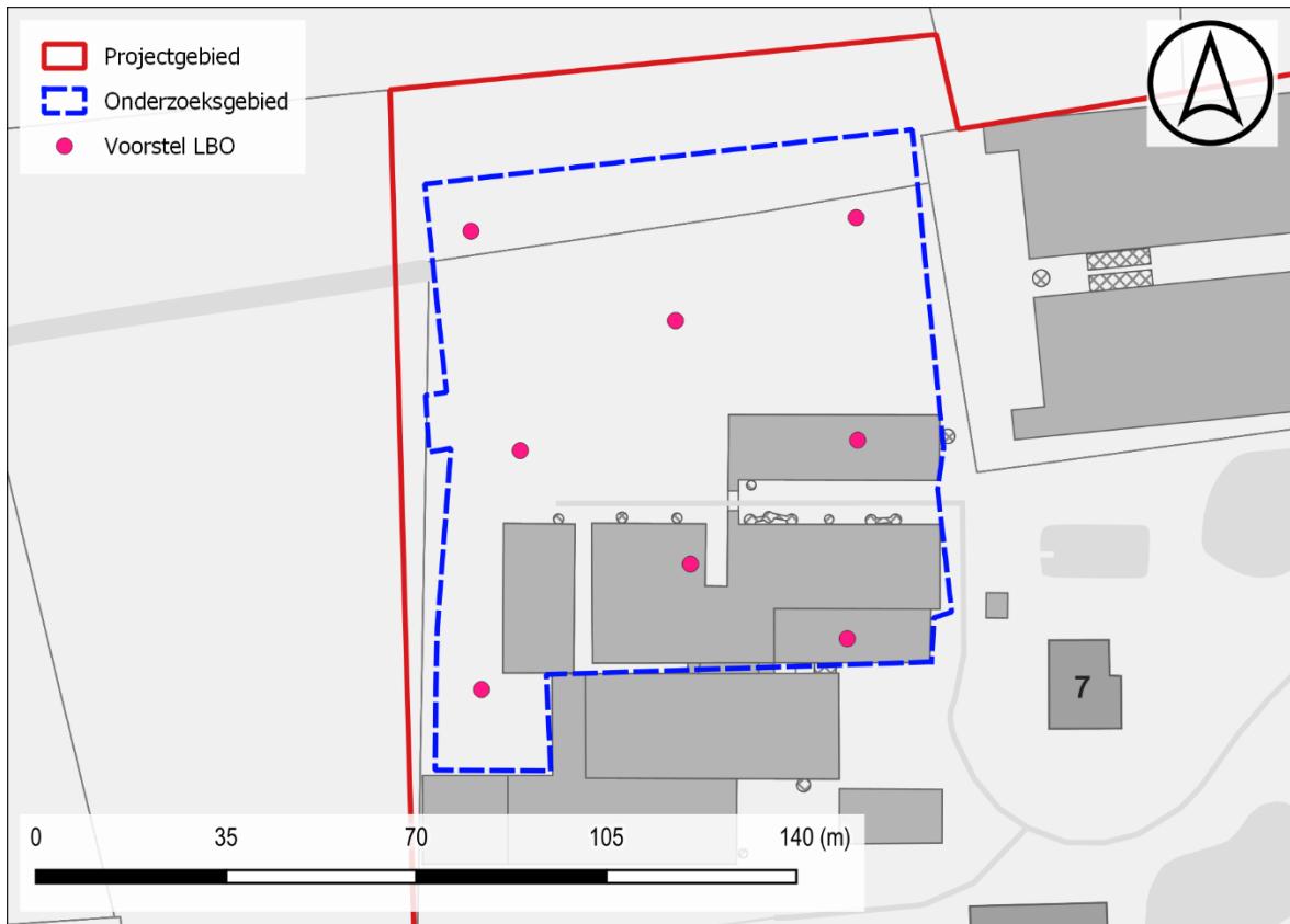
Figuur 3: Voorstel LBO t.a.v. GRB-basiskaart (© geopunt)