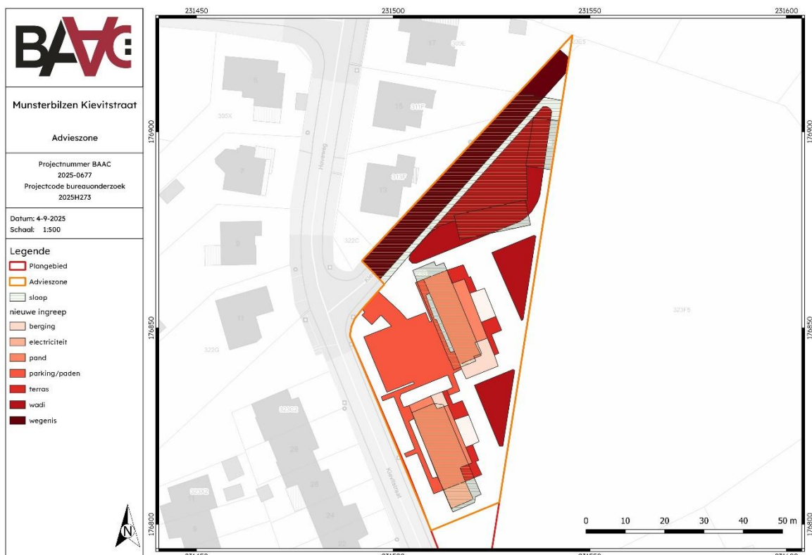
Plan 1: Plangebied met afbakening van de zone voor verder archeologisch onderzoek (digitaal; 1:1; 04.09.2025)

Het adviesgebied voor verder archeologisch onderzoek omvat het volledig plangebied, met uitzondering van een kleine zone in het zuiden, waar geen ingrepen gaan gebeuren. Zo wordt 3.531 m 2 geselecteerd voor verder onderzoek.