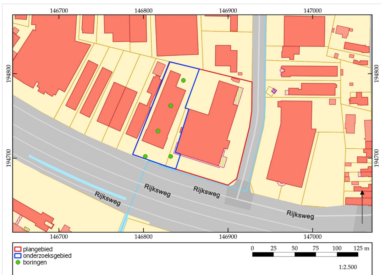
Figuur 3. Voorstel voor de boorlocaties in functie van het landschappelijk bodemonderzoek.

Om te bepalen of de bodem nog voldoende intact is om een goede bewaringstoestand van een eventuele steentijdsite te garanderen, zal in eerste instantie een landschappelijk bodemonderzoek uitgevoerd moeten worden in de eerste fase van het vervolgonderzoek. Hierbij zullen enkele boringen geplaatst worden, die inzicht zullen bieden in de bodemopbouw. Dit landschappelijk bodemonderzoek zal uitgevoerd worden aan de hand van een landschappelijk booronderzoek (Code van Goede Praktijk, paragraaf 7.3).