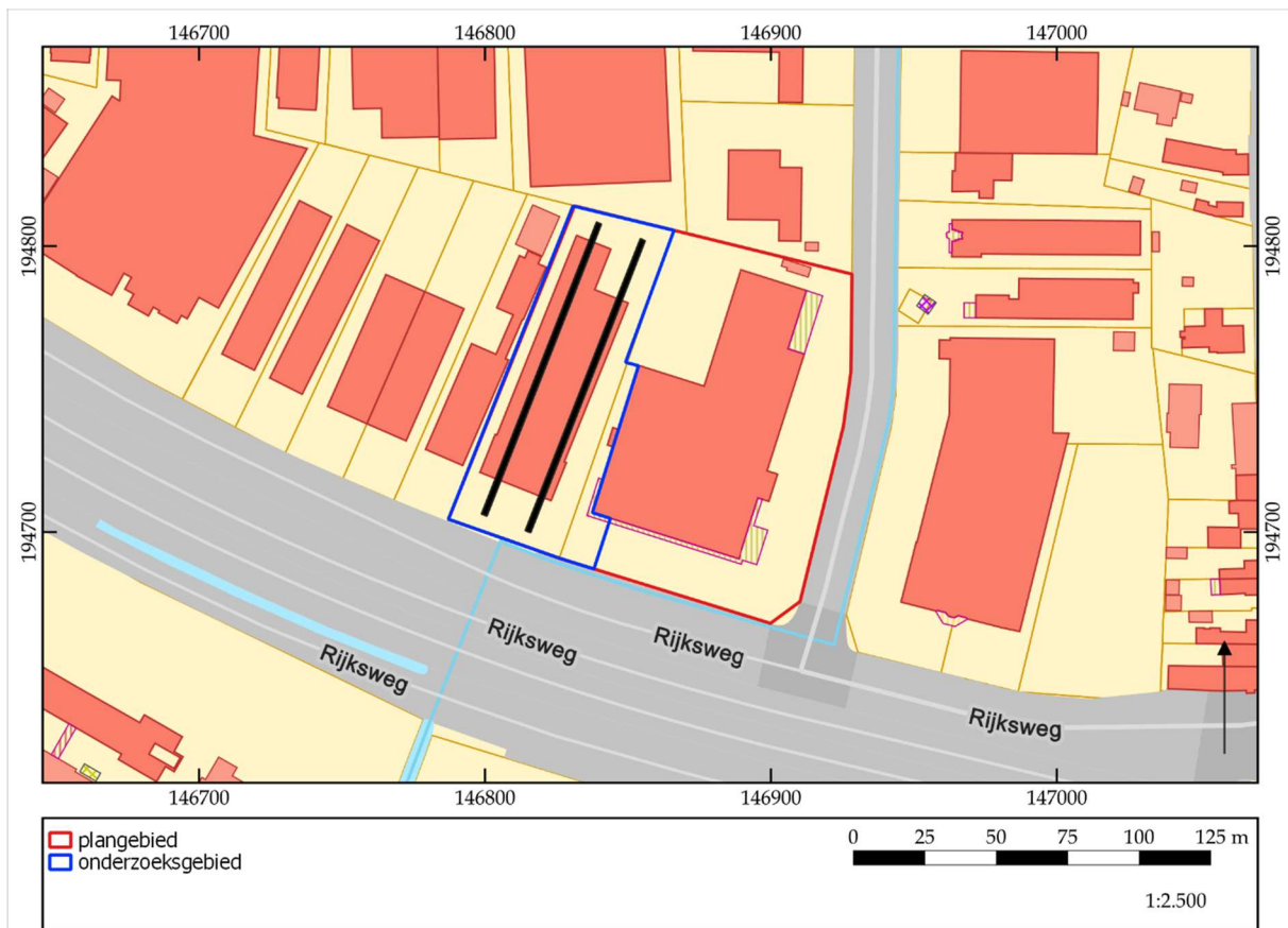
Figuur 4. Indicatieve ligging van de proefsleuven.

proefsleuven, zoals op figuur 4 is aangegeven, is indicatief. Het is toegestaan de exacte positie van de proefsleuven te wijzigen om praktische redenen of indien blijkt dat er zich, tegen de huidige verwachting in, toch een grote, diepgaande (recente) verstoring heeft voorgedaan op de positie van de betreffende proefsleuven. Idealiter wordt zo min mogelijk afgeweken van de voorgestelde locatie, hoewel uiteraard wel – indien nodig – uitbreidingen, proefputten en/of volgsleuven aangelegd kunnen worden om de resten op een gedegen manier te kunnen registreren en waarderen, de onderzoeksvragen te kunnen beantwoorden en de onderzoeksdoelen te bereiken.