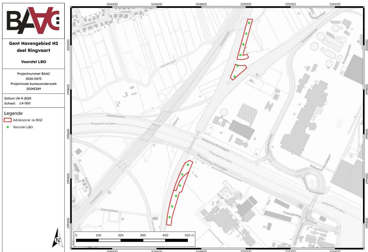
Plan 3: Inplantingsplan landschappelijke boringen zone 6 en 8 (digitaal; 1:1; 24.09.2025)