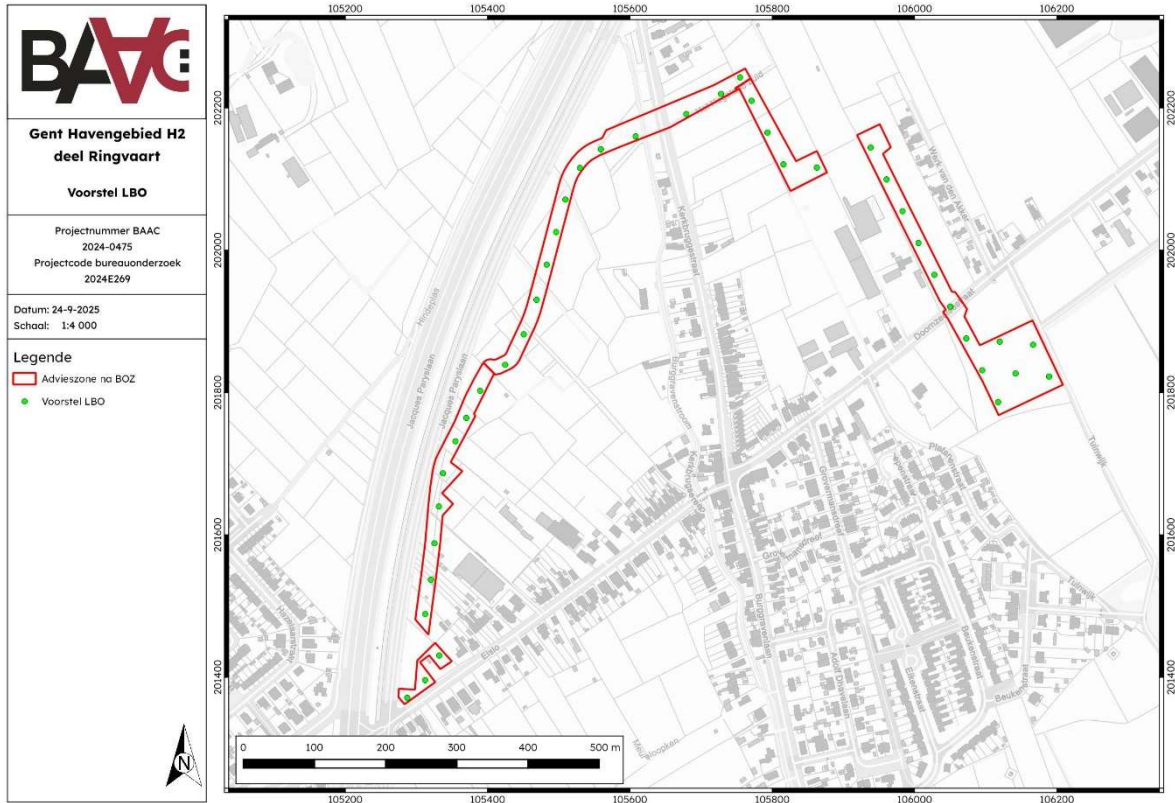
Plan 2: Inplantingsplan landschappelijke boringen zone 3 en 4 (digitaal; 1:1; 24.09.2025)