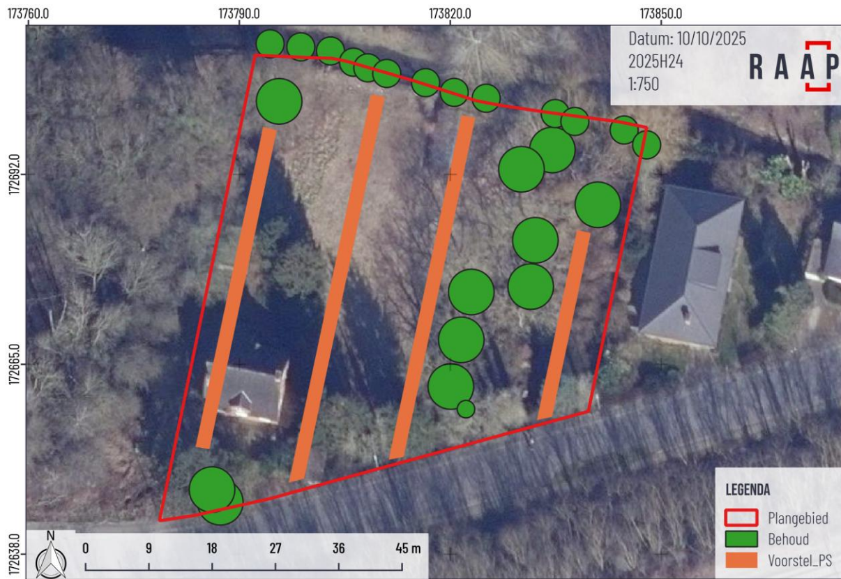
Figuur 4. Voorgesteld proefsleuvenplan geprojecteerd op recente luchtfoto.