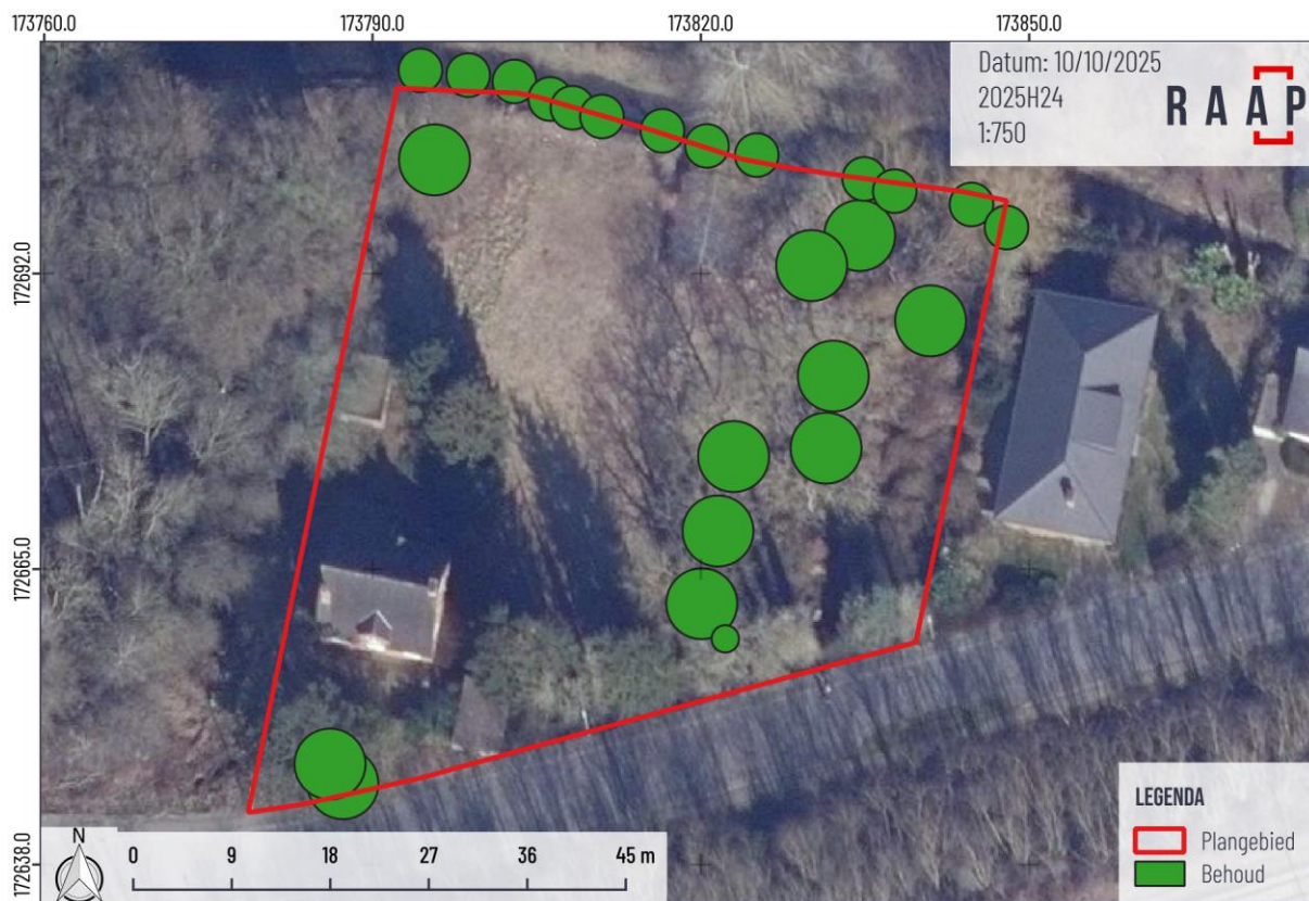
Figuur 1. Afbakening van het te onderzoeken terrein geprojecteerd op de luchtfoto.

De geplande werken omvatten de sloop van de bestaande bebouwing en het oprichten van een nieuwbouw met bijhorende omgevingsaanleg. Het volledige plangebied wordt daarom weerhouden als onderzoeksgebied, met uitzondering van de te behouden bomen binnen het plangebied.