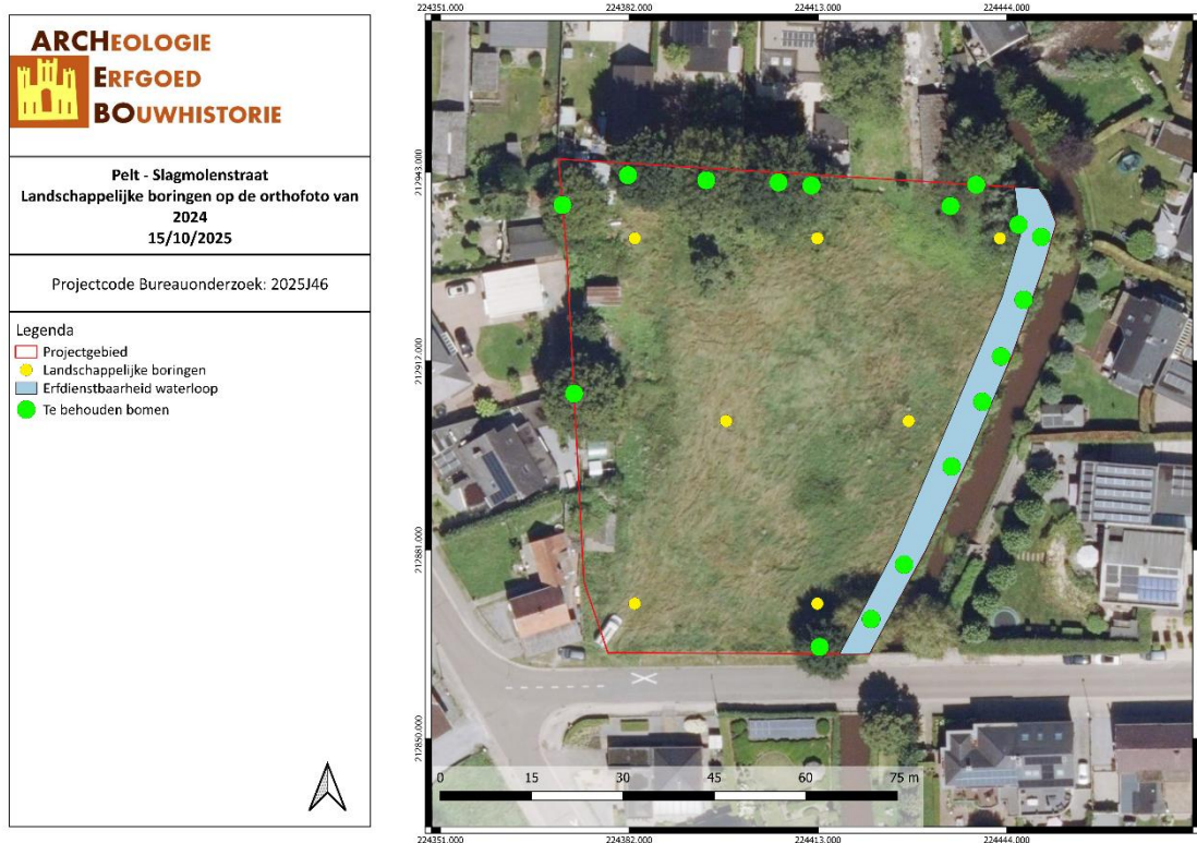
Figuur 3: Locatie boorpunten op het onderzoeksterrein (ARCHEBO bv, 2025)