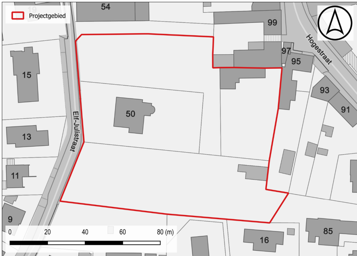
Figuur 1: Situering projectgebied t.a.v. GRB-basiskaart