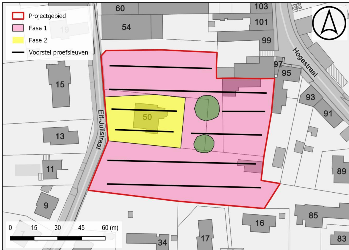
Figuur 3: Voorstel proefsleuven t.a.v. de GRB-basiskaart (© geopunt)

De geplande werken hebben betrekking op oppervlakte van ca. 9498 m 2 . De proefsleuven dienen 10% van de onderzoekbare oppervlakte te beslaan met bijkomend ca. 2,5% aan kijkvensters of dwars/volgsleuven waar relevant. De kijkvensters dienen voldoende groot te zijn om een antwoord te kunnen geven op de onderzoeksvragen.