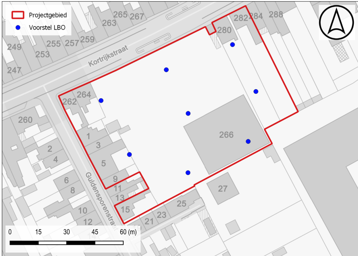
Figuur 2: Voorstel LBO t.a.v. GRB-basiskaart (© geopunt)

steentijdonderzoek in detail af te bakenen. Aangezien het landschappelijk bodemonderzoek als doel heeft de bodemopbouw binnen het plangebied te evalueren in functie van de archeologische bewaringscondities, dient het boorresidu niet gezeefd te worden. Mocht het omwille van praktische redenen aangewezen zijn dan kan gewerkt worden met profielputten i.p.v. boringen. Dit doet echter geen afbreuk aan de hoeveelheid waarnemingen of de spreiding ervan.