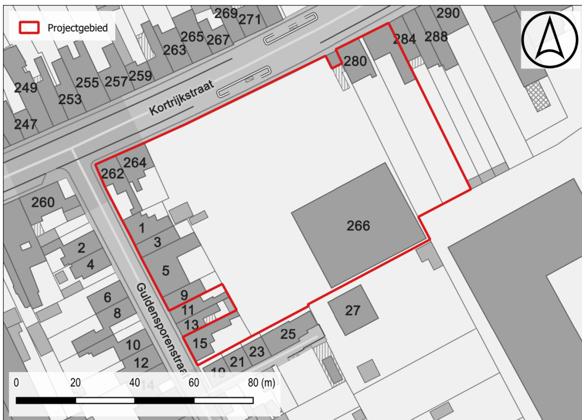
Figuur 1: Situering projectgebied t.a.v. GRB-basiskaart