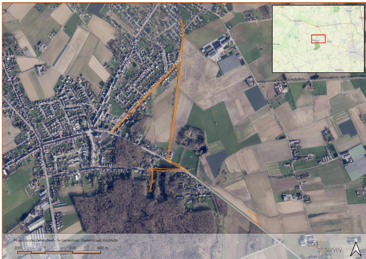
Figuur 1. Overzichtskartaar projectlocatie (360survey).

In het kader van de opmaak van een archeologienota (projectcode 2024J114) voor een projectlocatie ter hoogte van Stadenstraat en de Zarrendreef te Houthulst (zie Figuur 1) werd door de erkend archeoloog vastgesteld dat er een risico op het aantreffen van CTE (conventionele en toxische explosieven) bestaat.