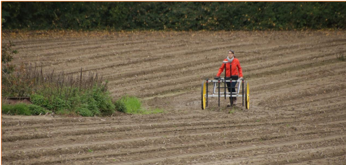
Figuur 3. Voorbeeldfoto oppervlakedetectie magnetometrie (360survey).

Door middel van deze detectie worden eventueel aanwezige ferrometallische bodemvreemde objecten of structuren in kaart gebracht. Dit kan een meer gerichte plaatsing van eventuele bodemingrepen faciliteren en zorgt ervoor dat een CTE-deskundige doelgericht en daardoor kostenefficiënt ingezet kan worden. Het detectieresultaat wordt opgeleverd onder de vorm van een detectierapport met objectlijst (gecategoriseerd naar magnetisch moment en gemodelleerde begravingsdiepte), objectkaart en vervolgadvis. Daarnaast zijn de data van nut voor de risicobeheersing van de feitelijke bouwwerkzaamheden in een latere fase van uitvoering. Voor de overige deelgebieden achten wij de uitvoering van een detectie niet zinvol.