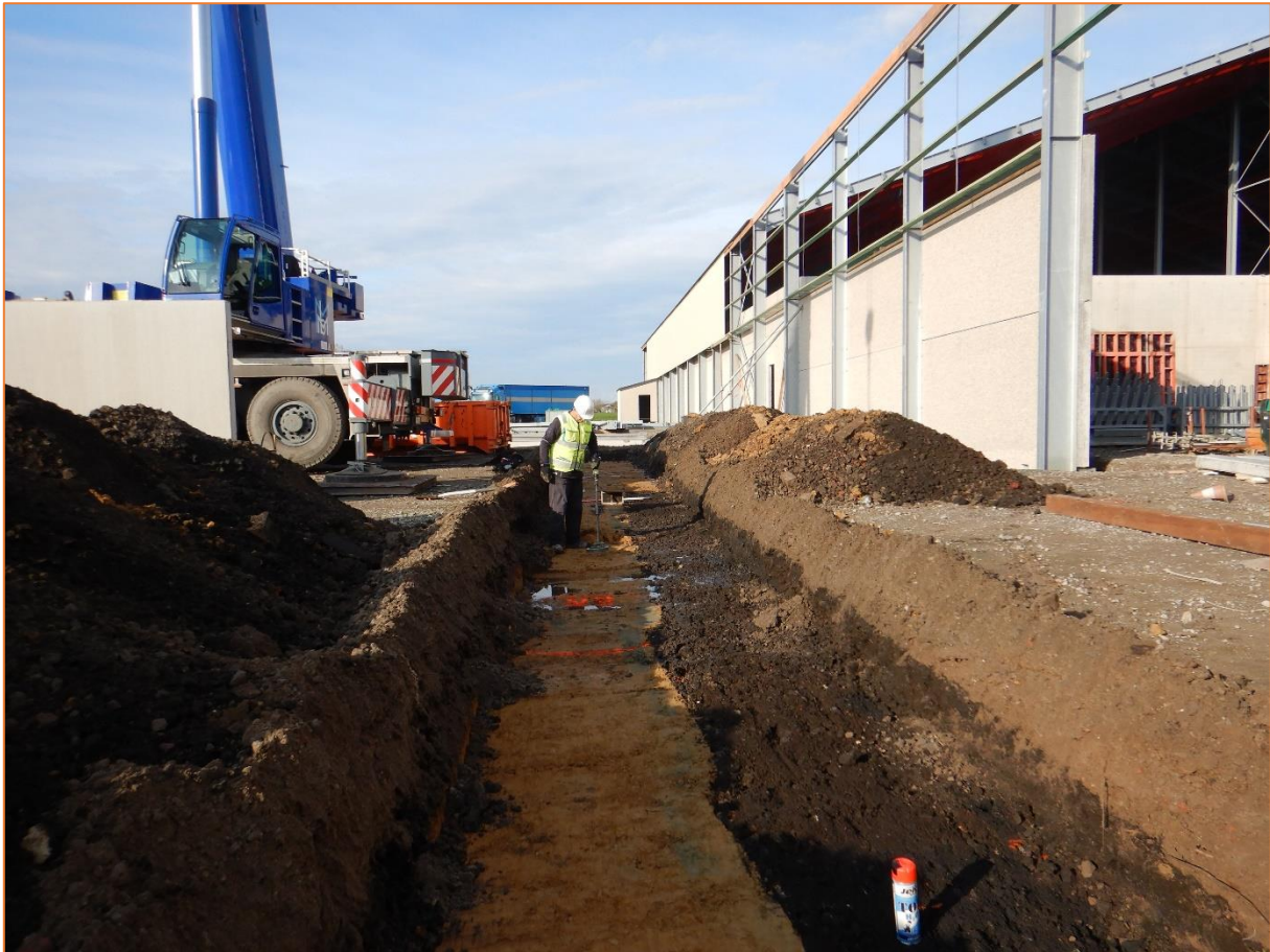
Figuur 4. Voorbeeldfoto begeleiding van graafwerkzaamheden in een proefsleuf.

Middels genoemde maatregelen wordt enerzijds de waarschijnlijkheid op schade en de ernst bij blootstelling gereduceerd. Dit brengt het risico voor een bodemingreep terug naar: