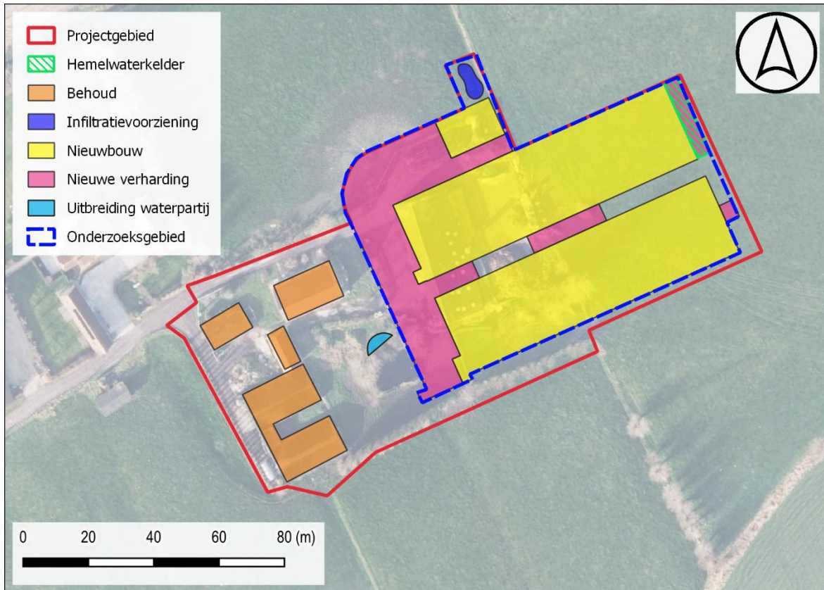
Figuur 2: Onderzoeksgebied weergegeven op de meest recente luchtopname.

De onderzoekssequentie heeft betrekking op de volledige zone waar bodemingrepen plaatsvinden met uitzondering van de uitbreiding van de reeds bestaande waterpartij. Verdere opvolging van deze geïsoleerde en kleine ingreep zal niet leiden tot kenniswinst. De oppervlakte van het onderzoeksgebied bedraagt ca. 7278 m 2 .