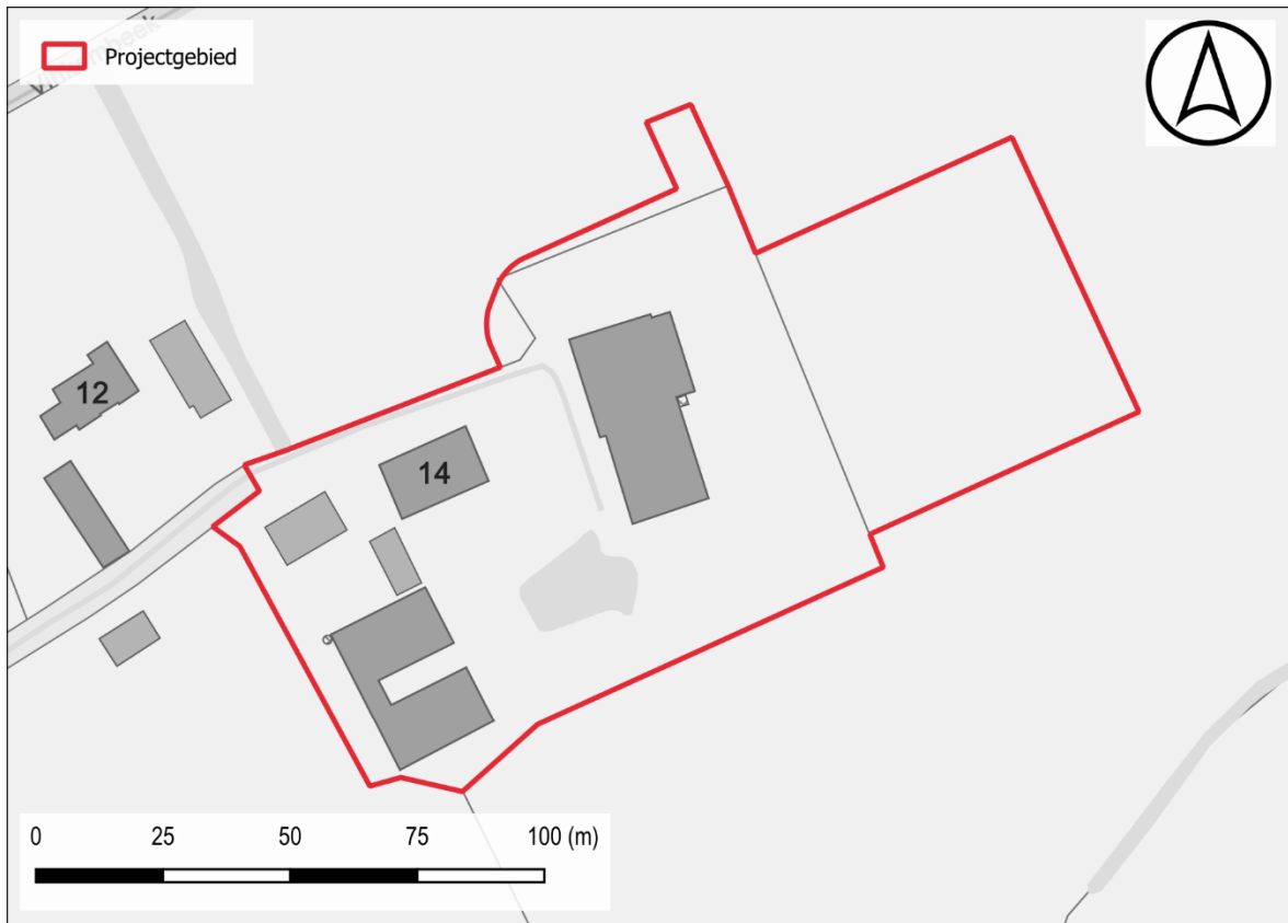
Figuur 1: Situering projectgebied t.a.v. GRB-basiskaart