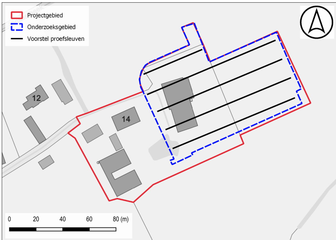
Figuur 4: Voorstel proefsleuven t.a.v. de GRB-basiskaart

De geplande werken hebben betrekking op oppervlakte van ca. 7698 m 2 . De proefsleuven dienen 10% van de onderzoekbare oppervlakte te beslaan met bijkomend ca. 2,5% aan kijkvensters of dwars/volgsleuven waar relevant. De kijkvensters dienen voldoende groot te zijn om een antwoord te kunnen geven op de onderzoeksvragen.