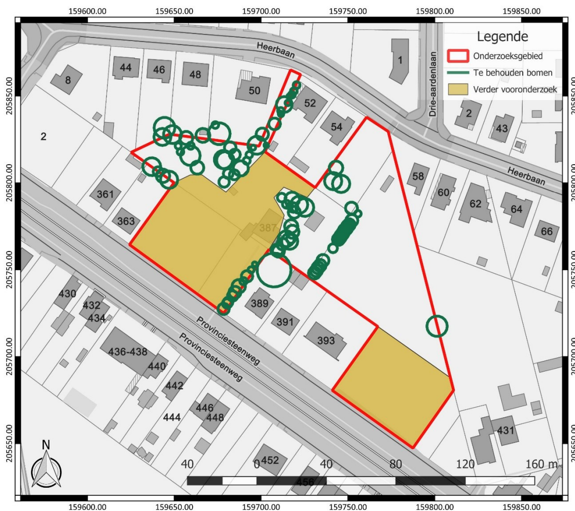
Figuur 2: Zone afgebakend voor verder vooronderzoek, weergegeven op het GRB ( www.geopunt.be )

De onderzoeksdoelen zijn succesvol bereikt wanneer de vooropgestelde onderzoeksvragen en de bijkomende onderzoeksvragen die opgesteld worden naar aanleiding van elk assessment beantwoord zijn.