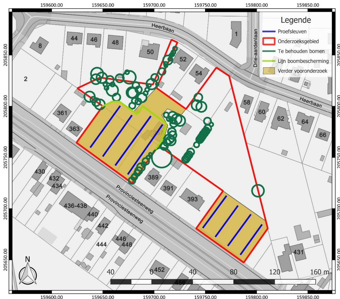
Figuur 4: Inplanting van de proefsleuven (blauw), binnen het onderzoeksbied (rood), weergegeven op het GRB ( www.geopunt.be )

De proefsleuven hebben een maximale tussenafstand van middelpunt tot middelpunt van 15 m. De beoogde oppervlakte die onderzocht dient te worden door middel van proefsleuven, bedraagt minimaal 10 %. Dit wordt net niet behaald aan de hand van het vooropgestelde sleuvenplan, dat voorziet in 360 lopende m proefsleuven. Dit komt neer op een onderzocht percentage van 9,84 %.