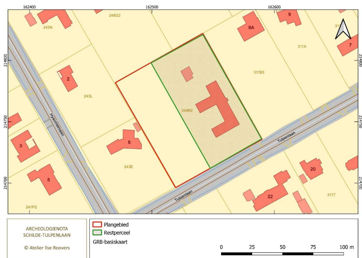
Figuur 1: Afbakening van het plangebied op het grootschalig referentie bestand

De aanleiding tot de opmaak van deze archeologienota is aanvraag van een omgevingsvergunning voor een geplande verkaveling in de Tulpenlaan 11 in 's Gravenwezel, deelgemeente van Schilde, op de kadastrale percelen 3 de afdeling, sectie C, nrs. 248r2 en 248z . De percelen zijn in woonparkgebied gelegen. De totale oppervlakte van het terrein bedraagt momenteel 8.300 m 2 . De aanvraag houdt de afsplitsing in van een onbebouwd perceel van 3.300 m 2 (lot 1) en het behoud van een reeds ingericht perceel van 5.000 m 2 met een woning en omgevingsaanleg (restperceel).