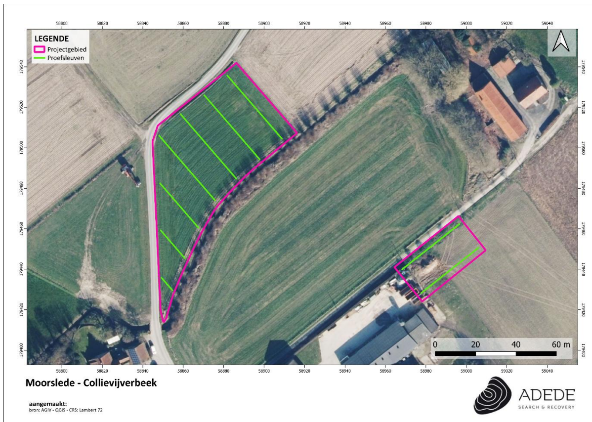
Figuur 2. Proefsleuvenplan