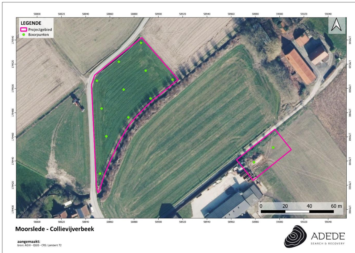
Figuur 1. Boorplan