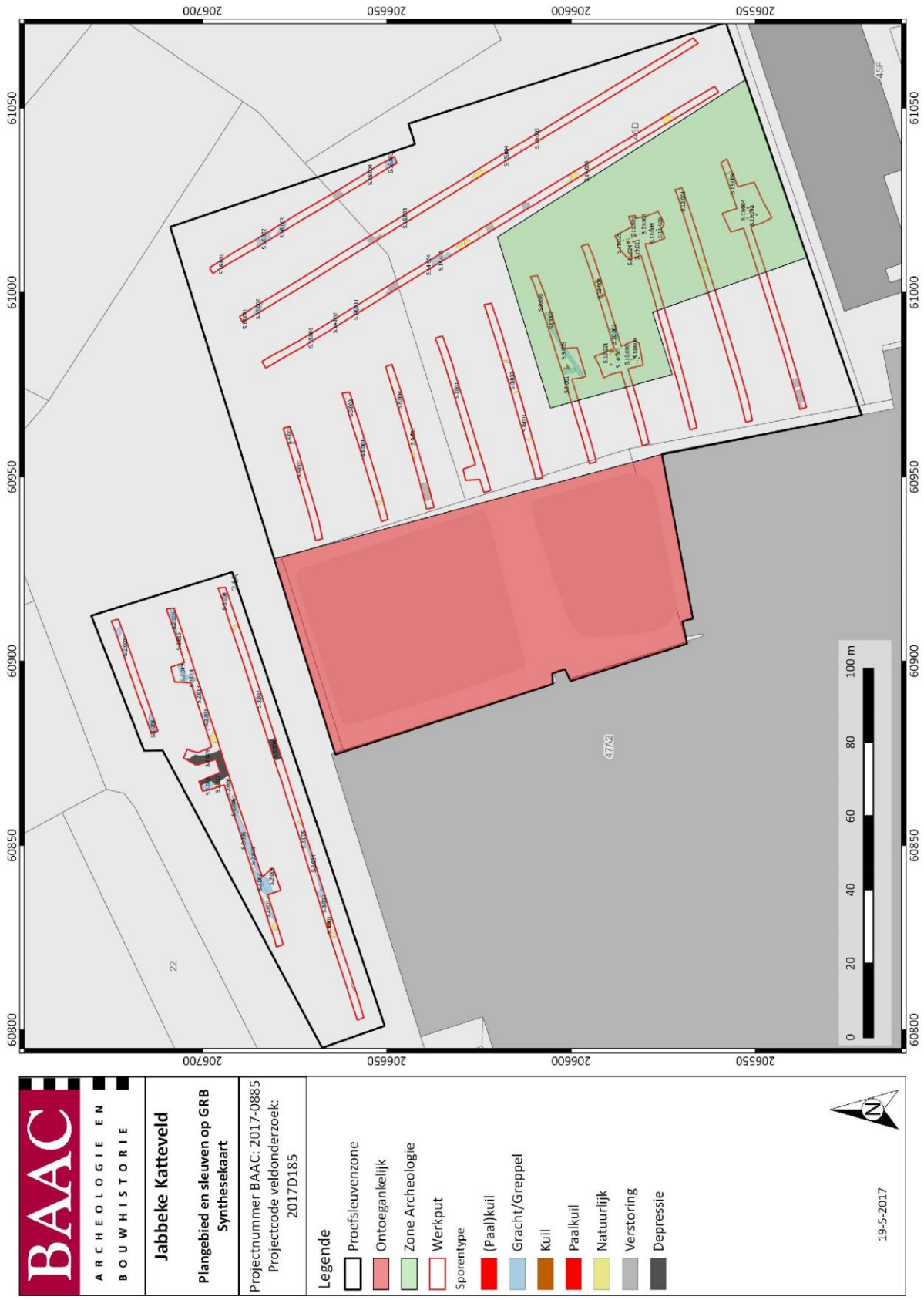
Figuur 1: Synthesekaart met aanduiding van de waardevolle archeologische zone (groen)