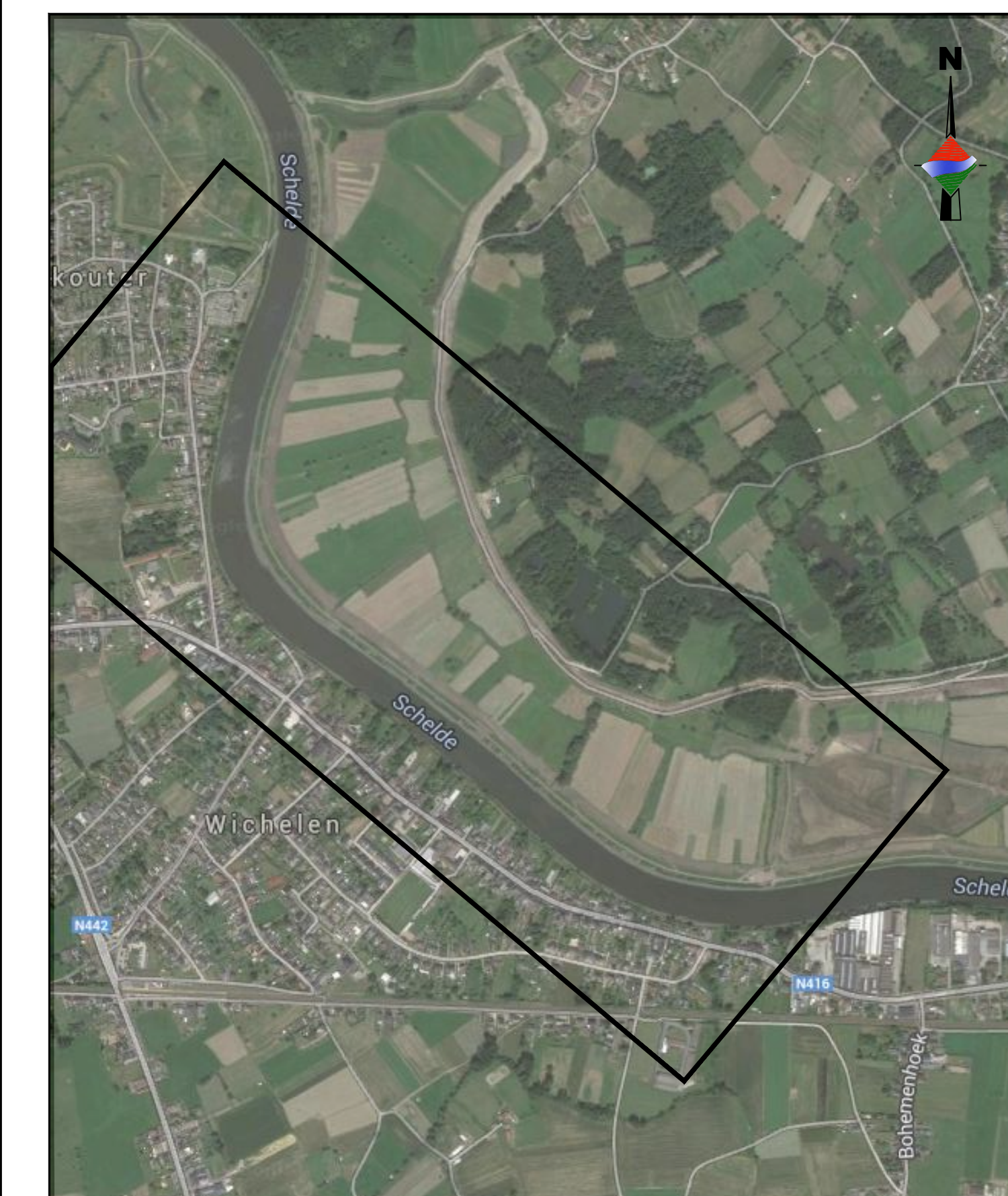
Inplantingsplan Schaal 1/10.000