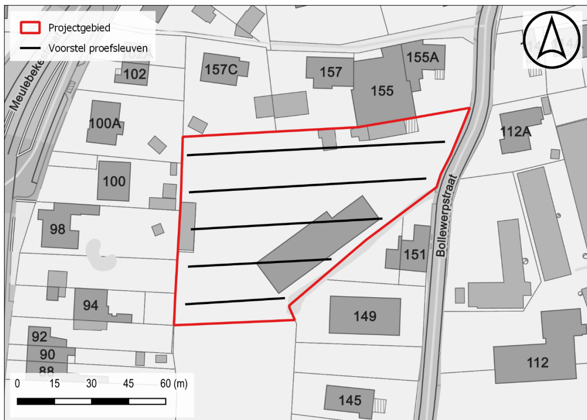
Figuur 3: Voorstel proefsleuven t.a.v. de GRB-basiskaart

De geplande werken hebben betrekking op oppervlakte van ca. 6503 m 2 . De proefsleuven dienen 10% van de onderzoekbare oppervlakte te beslaan met bijkomend ca. 2,5% aan kijkvensters of dwars/volgsleuven waar relevant. De kijkvensters dienen voldoende groot te zijn om een antwoord te kunnen geven op de onderzoeksvragen.