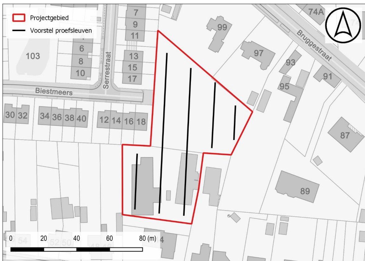
Figuur 3: Voorstel proefsleuven t.a.v. de GRB-basiskaart

De geplande werken hebben betrekking op oppervlakte van ca. 4842 m 2 . De proefsleuven dienen 10% van de onderzoekbare oppervlakte te beslaan met bijkomend ca. 2,5% aan kijkvensters of dwars/volgsleuven waar relevant. De kijkvensters dienen voldoende groot te zijn om een antwoord te kunnen geven op de onderzoeksvragen.